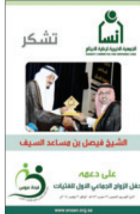
إهداء قيمته فتيات الجمعية تحريماً للنام