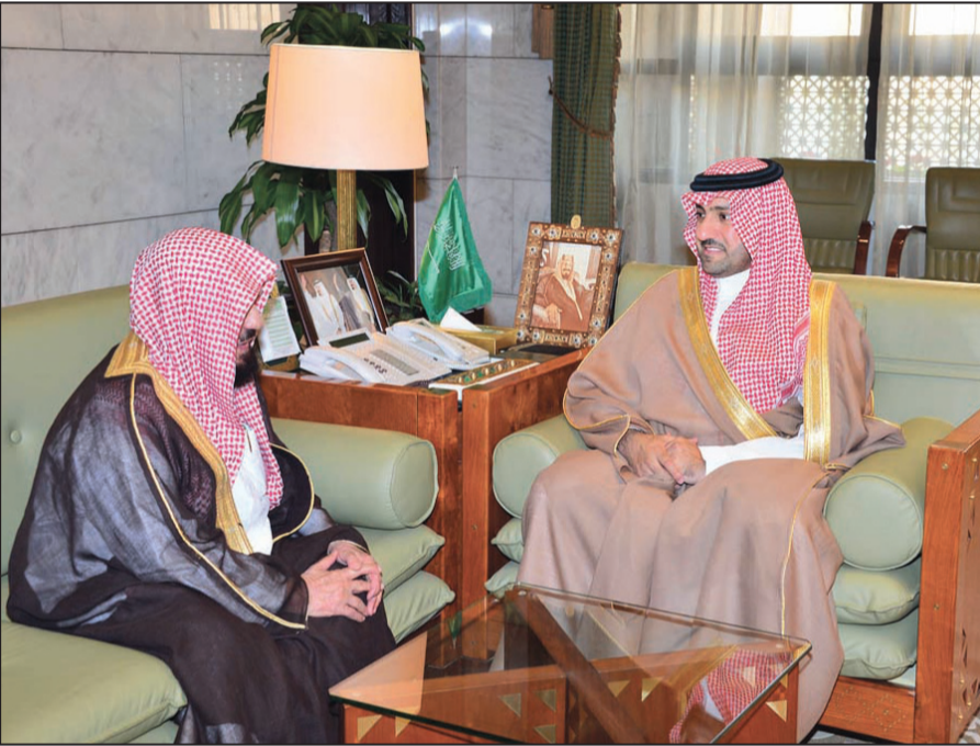
الأمير تركي بن عبدالله مستقبلاً الشيخ ابن منيع

الرياض - واس استقبل صاحب السمو الملكي الأمير تركي بن عبدالله بن عبدالعزيز أمير منطقة الرياض في مكتب سموه بقرص الحكم أمس، عضو هيئة كبار العلماء المستشار في الديوان الملكي الشيخ عبدالله بن سليمان بن منيع.