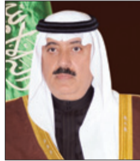
الأمير متعب بن عبدالله

بين البلدين الصديقين، وتفتح أفقا أرحب للتعاون وتبادل الآراء وجهات النظر لاسيما وأن المملكة العربية السعودية بقيادة خادم الحرمين الشريفين الملك عبدالله بن عبدالعزيز آل سعود تمثل نقلا سياسيا واقتصاديا إقليميا ودوليا، إلى جانب ما للبلدين الصديقين من رؤية مشتركة وتفهم كامل لجميع المستجدات والموضوعات المطروحة على الصعيد الدولي الذي تسهم المملكة العربية السعودية والولايات المتحدة الأمريكية فيها بدور فاعل وإيجابي.