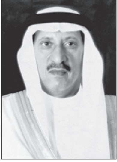
الأمير تركي بن ناصر

جدة - واس ■ أكد صاحب السمو الملكي الأمير تركي بن ناصر بن عبدالعزيز الرئيس العام للأرصاد وحماية البيئة أن مناسبة مرور سبع سنوات على تولي خادم الحرمين الشريفين الملك عبد الله بن عبدالعزيز آل سعود مقاليد الحكم في المملكة تحل والمملكة تفخر بمكانة العز والمنعة التي نالتها بين أمم الأرض جد وتفان تحت قيادته وسمو ولي عهده الأمين - حفظهما الله - لتحقيق المزيد من الخير والنماء.