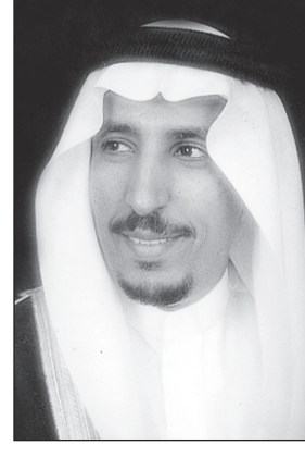
الأمير سعود بن عبدالله بن فهد

وأضاف: وحكم نعتز في الهيئة الملكية للجبيل وينبع بكل ذلك الاهتمام المتواصل من لدن القيادة الحكيمة بالهيئة الملكية وبكل ما تتلقاه من دعم غير محدود مكن بعد توفيق الله من تحقيق العديد من المنجزات العملاقة هذه المنجزات التي كانت حبراً على ورق فأضحت حقيقة مثالية للعيان بفضل الله سبحانه بثمنه بحكمة ودعم قائداً وباني نهضتنا خادم الحرمين الشريفين الملك عبد الله بن عبدالعزيز.. متمنعه الله بالصحة والعافية.. لفضائل السنوات السبع الماضية لخادم الحرمين الشريفين