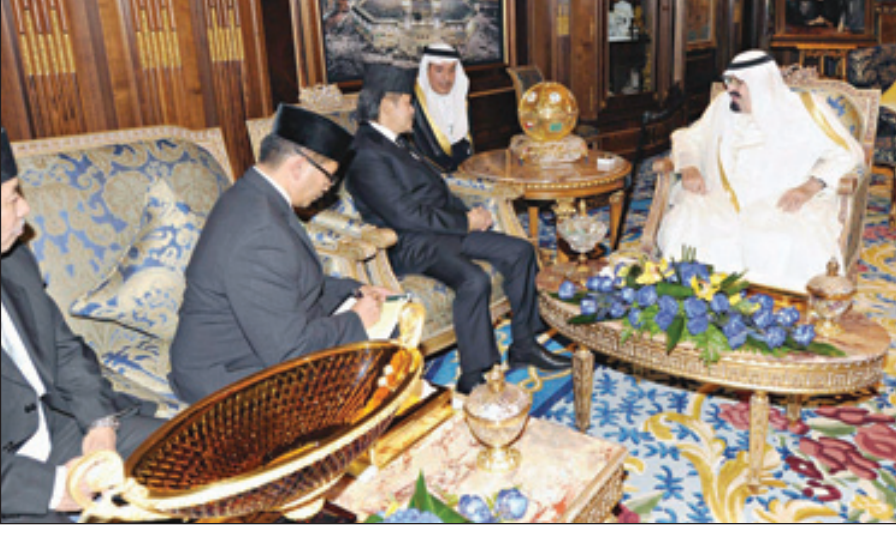
خادم الحرمين خلال الاستقبال