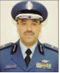
اللواء سعيد الزهراني