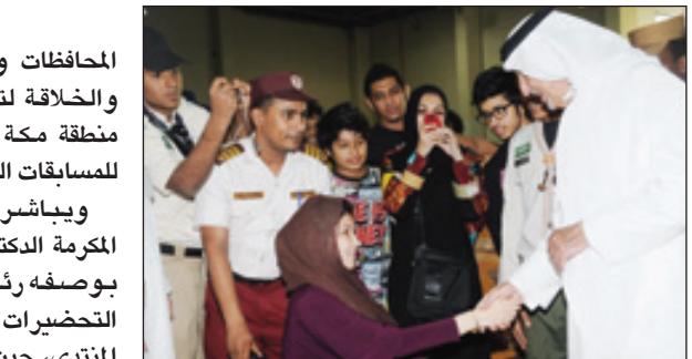
الأمير خالد الفيصل يسلم على إحدى الشبابات