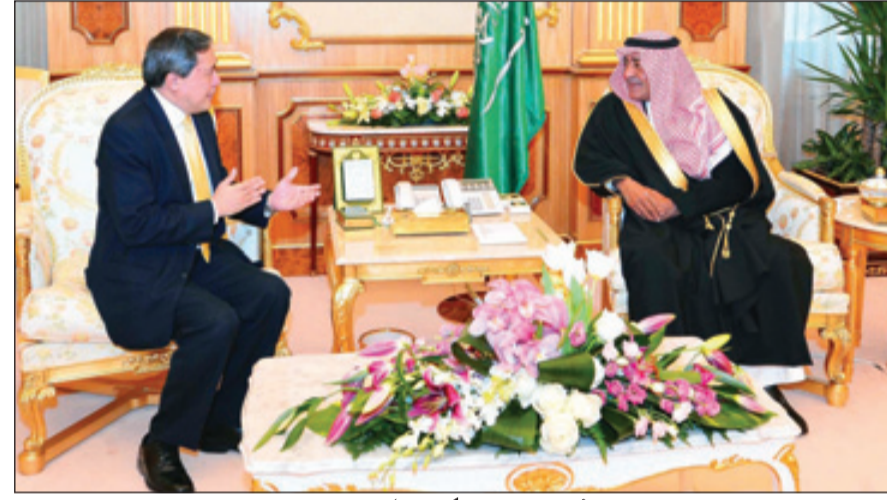
الأمير مقرن مستقبلاً السفير الأذربيجاني

الرياض - واس ■ استقبل صاحب السمو الملكي الأمير مقرن بن عبدالعزيز آل سعود ولي العهد نائب الثاني لرئيس مجلس الوزراء المستشار والمبعوث الخاص لخادم الحرمين الشريفين -حفظه الله- في مكتبه بقصر