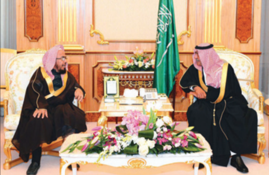
ولي ولي العهد مع الشيخ الدكتور المطلق

الوطنية والعمل على تحقيق الأهداف السامية للمركز وتطلعات خادم الحرمين