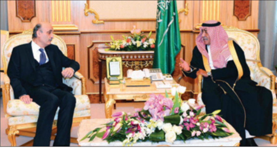
الأمير مقرن لدى لقاء الدكتور جعجع

البيامة في الرياض، رئيس حزب القوات اللبنانية الدكتور سمير جعجع. وجرى خلال الاستقبال تبادل الأحاديث الودية إلى جانب استعراض الموضوعات ذات الاهتمام المشترك، بحضور رئيس جهاز العلاقات الخارجية في القوات اللبنانية بيار يوعاصي.