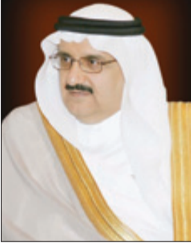
الأمير، منصور بن متعب

تحتوي به وزارة الشؤون البلدية والقروية من لدن لخدام الحرمين الشريفين الملك عبدالله بن عبدالعزيز، وسمو ولي ولي العهد صاحب السمو الملكي الأمير مقرن بن عبدالعزيز -حفظهم الله جميعاً- ومن جهته أصدر سمو الأمير منصور بن متعب تعليماته