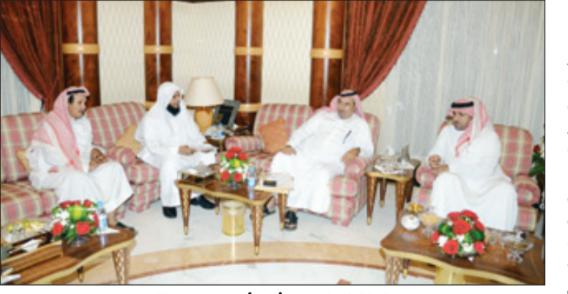
والد القاتل يعن تنازله أمام الأمير تركي بن عبدالله