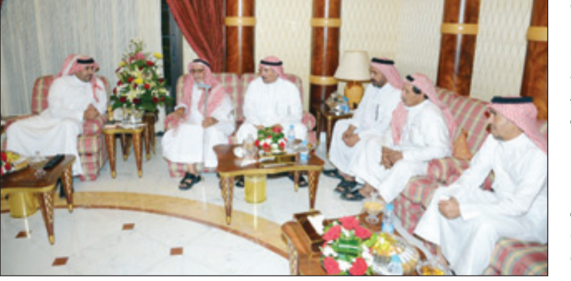
أمير الرياض مستقبلاً ذوي القاتل

يعد نفسه في كل شفاعة أحد أطراف أهل المقتول، تقديراً لمشارع نوبه، وتأكيداً لهم على أن طلب العفو إنما هو احتساب للأجر، وحقق للدماء، بعد التأكد المطلق لهم بأن من حققهم إنفاذ حكم الشرع بالقصاص في حال عدم قبولهم التنازل والعفو، لكنهم متى ارتضى أولياء الدم العفو والتنازل فإنهم في اللجنة ينقلون سلام خادم الحرمين لهم وطلبه لإشراكهم في العفو، وأضاف الشيخ الجريا الدماء على عفوهم وتنازلهم واستجابتهم إنه بفضل المتابعة الدائمة من سمو أمير لشفاعة خادم الحرمين يحفظه الله.