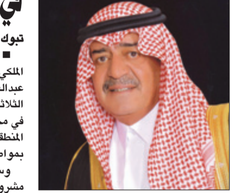
الأمير مقرن بن عبدالعزيز

بعض صاحب السمو الملكي الأمير مقرن بن عبدالعزيز آل سعود ولي ولي العهد النائب الثاني لرئيس مجلس الوزراء المستشار والمبعوث الخاص لخدام الحرمين الشريفين برفقة زراء ومواساة لصالح العجروش وإخوانه في وفاة شقيقتهم نورة -رحمها الله - وقال سمو ولي ولي العهد في بريقته "علمنا نبأ وفاة شقيقتهم نورة -رحمها الله - وكدرنا ذلك، وإنما إن نعرب لكم ولابن القفيدة ولأسرتكم الكريمة عن أحر تعازينا وصادق مواساتنا، لنسال المولى القدير أن يتغمد القفيدة بواسع رحمته ويسكنها فسيح جنته، ويلهمكم الصبر والسلوان".