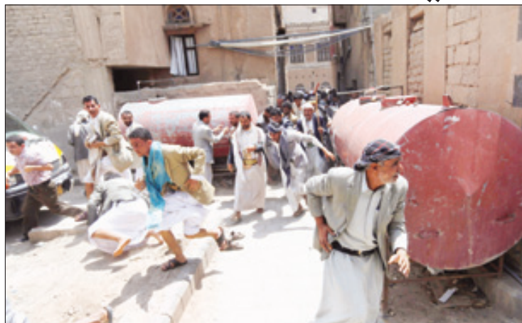
الاحتجون يهربون من رجال الأمن

مبنى مجلس الوزراء ومبنى إذاعة صنعا في محيط الإذاعة ومجلس الوزراء ومن أوساط محاولي الاقتحام والذين تقوم الأجهزة الأمنية حاليا بالبحث عنهم وتعتقبهم تمهيدا لضبطهم وإحالتهم للجهات المختصة". وأضاف: "إن حراسات مجلس الوزراء وإذاعة صنعا لم تقم بإطلاق النار الجي نحو محاولي اقتحام مجلس الوزراء"، محملا القيادات الحوثية كافة المسؤولية في التحريض على اقتحام