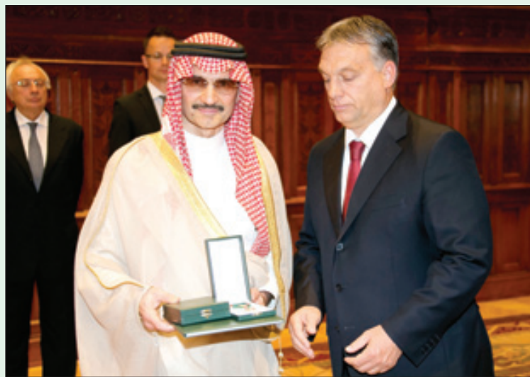
الأمير الوليد بعد تلقيه وسام الدولة من رئيس الوزراء الجرمينح وزير الدفاع السعودي الأمير Turki بن سعود بن عبدالعزيز آل سعود، مدير أول إدارة السفريات والتنسيق الخارجي، والأستاذ هاني أغا، مدير التنفيذية الخاصة لسومو رئيس مجلس الإدارة والأستاذة حسناء التركي، رئيسة قسم إدارة السفريات والتنسيق مجلس الإدارة.

زار صاحب السمو الملكي الأمير الوليد بن طلال بن عبدالعزيز رئيس مجلس إدارة شركة المملكة القابضة ومؤسسات الوليد بن طلال الخيرية، والوفد المرافق بواباست. وخلال الزيارة توجه الأمير الوليد إلى مبنى البرلمان الهنغاري والتقى السيد فكتور أوربان رئيس وزراء جمهورية المجر. وخلال اللقاء تناول رئيس الوزراء والأمير الوليد عدد من المواضيع الاجتماعية والاستثمارية. ومن ثم أقيم حفل تكريم للأمير الوليد حيث منح فخامة رئيس جمهورية المجر السيد يانوش أدير "وسام الدولة" للأمير الوليد وقام رئيس الوزراء بتسليم الوسام لسومو والذي يعتبر الوسام الـ ٧٤ لسومو، وقد حضر مراسم التكريم عدد من كبار الشخصيات والصحافة. وتضمن الوفد كل من الأستاذ حاتم الغامدي، رئيس البعثة في سفارة