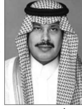
الأمير مشاري بن سعود

الحضارية وأعطت العلم والتعليم أهم الأولويات باعتباره الطريق نحو سبيل التقدم، فشجيت المملكة على عقود بسيطة منظومة علميه من المدارس والمعاهد والجامعات لصناعة معرفيه لكل مواطن، وصاحب تلك عطاءات متوازنة في شتى فرص الحياة ضمن جدول زمني يراعي الأولويات والأساسيات وفق منظور تخطيطي مدروس. لهذا فإن المتعجب لمنجزات المملكة الحضارية عبر خطط التنمية يلمس فيها أسلوب التدرج والتنوع الذي يوفر البيئة التنموية المستديمة والشاملة، ولعل هذا النمط وفر ولله الحمد الكثير من المنجزات الكبيرة والمستجيبة مع حاجة الإنسان ومراحل النمو والتطوير، مما أعطى هذا النمط التميز للمملكة نقلا اقتصاديا تنمويا بارزا بين صفوف دول العالم. ولعل ما تشهده المملكة في عهد سيدي خادم الحرمين الشريفين الملك عبدالله بن عبدالعزيز آل سعود وسمو