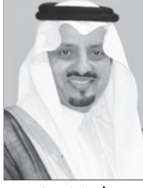
الأمير فيصل بن خالد

وزاد سموه: لا ننسى كذلك في هذا اليوم المجيد رجلين عظيمين ساهما مساهمة كبيرة في مسيرة هذه البلاد وهما الأمير سلطان بن عبدالعزيز والأمير نايف بن عبدالعزيز -رحمهما الله - فقد كانوا مع إخوانهم خير أمناء على هذه البلاد فجزاهم الله عن ذلك العمل الصالح خير الجزاء. وأضاف سموه تستمر آيات العرفان والتقدير موصولة لقائد مسيرتنا وفارس نهضتنا سيدي خادم الحرمين الشريفين الملك عبدالله بن عبدالعزيز وسيدي سمو