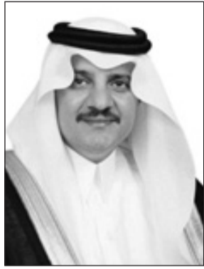
الأمير سعود بن نايف

الحرمين الشريفين الملك عبدالله بن عبدالعزيز آل سعود، وصاحب السمو الملكي الأمير سلمان بن عبدالعزيز آل سعود ولي العهد نائب رئيس مجلس الوزراء وزير الدفاع، وصاحب السمو الملكي الأمير مقرن بن عبدالعزيز آل سعود النائب الثاني لرئيس مجلس الوزراء المستشار والمبعوث الخاص لخادم الحرمين الشريفين - حفظهم الله - أصبحت نرى الإنجازات تتحقق في بلادنا على مختلف الأصعدة الاقتصادية والسياسية والاجتماعية حيث تحققت إنجازات كثيرة أسهمت في تعزيز النمو الاقتصادي وحققت الاستفادة القصوى من الموارد الاقتصادية وشجنت مشاريع عملاقة وأسهمت في زيادة فرص العمل للمواطنين. أسأل الله العلي القدير أن يديم على وطننا نعمة الأمن والاستقرار في ظل حكومتنا الرشيدة. أيدها الله - وأن يديم علينا نعمه ويوفق خادم الحرمين الشريفين - حفظه الله - والشعب السعودي الأبي لما فيه الخير والتقدم لبلادنا الغالية.