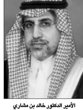
الأمير الدكتور خالد بن مشاري

المقدسة للمسلمين من أنحاء العالم ومد يد العون والمساعدة لشعوب الأرض وبالأخص المسلمين منهم والإسهام في نشر الإسلام والسلام والتفاهم بين شعوب العالم. وأوضح سموه أن قيادات المملكة من بعد الملك المؤسس -رحمه الله- استمرت على نهجه وتابعت مسيرة التنمية للمملكة في المجالات المعيشية والاقتصادية والتعليمية والصحية والاجتماعية والعمرانية وغيرها من المجالات التنموية التي حولت المملكة إلى أن تصبح إحدى دول العشرين الأكثر متانة اقتصادياً وسياسياً، ولفت الانتباه إلى أن