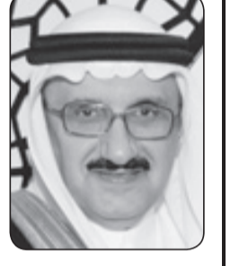
منصور بن متعب*

وزاد سموه: لا ننسى كذلك في هذا اليوم المجيد رجلين عظيمين ساهما مساهمة كبيرة في مسيرة هذه البلاد وهما الأمير سلطان بن عبدالعزيز والأمير نايف بن عبدالعزيز -رحمهما الله - فقد كانوا مع إخوانهم خير أمناء على هذه البلاد فجزاهم الله عن ذلك العمل الصالح خير الجزاء. وأضاف سموه تستمر آيات العرفان والتقدير موصولة لقائد مسيرتنا وفارس نهضتنا سيدي خادم الحرمين الشريفين الملك عبدالله بن عبدالعزيز وسيدي سمو