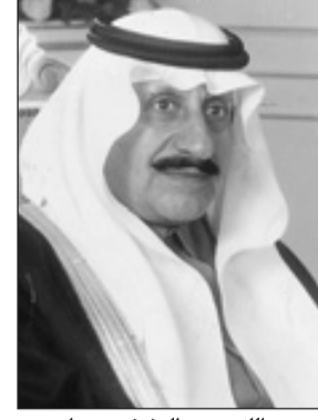
عبدالله بن عبدالعزيز بن مساعد

عمر - واس ■ وصف صاحب السمو الأمير عبدالله بن عبدالعزيز بن مساعد أمير منطقة الحدود الشمالية اليوم الوطني الثالث السعودية بأنه يوم تاريخي ويوم مشهود لما تحققت بفضل الله ثم بفضل الصدق مع النفس أجلاها الملك عبدالعزيز رحمه الله، ومن ثم سار على ربه أبناءه من بعده حتى وصلت القيادة إلى عهد خادم الحرمين الشريفين الملك عبدالله بن عبدالعزيز - حفظه الله - الذي شهدت المملكة في عهده نقلة حضارية في شتى مجالات الحياة، وجاهها المحلي نعمًا كثيرة في مقدمتها نعمة الأمن التي ينعم بها المواطن والقيم، ولقد واصلت بلادنا التقدم