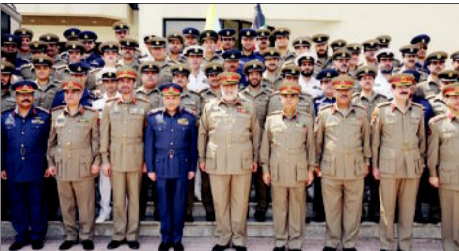
الفريق الخالد متوسطا الضباط المرقيين

الشيخ جابر المبارك، وتمنى أن تكون هذه الترقية دافعا للضباط المرقيين لبذل المزيد من الجهد والعطاء المتواصل والتفدي بحسن القيادة والتدريب والمتابعة ووضع كل قدراتهم لخدمة الوطن. كما أعرب عن الأمل للكويت الأمن والاستقرار تحت ظل صاحب السمو أمير البلاد وسمو ولي العهد وسمو رئيس مجلس الوزراء. وحضر مراسم التقليد نائب رئيس الأركان العامة للجيش الفريق الركن خالد الجراح وأعضاء مجلس الدفاع العسكري.