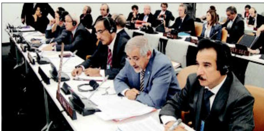
السفير مترنسا وفد الكويت في الاجتماع

كونا - قدم وزير الصحة الدكتور هلال السايير ورقة الكويت حول الامراض غير المعدية وطرق مكافحتها امام الاجتماع الصحي الدولي رفيع المستوى في الامم المتحدة. وأكد السايير أمام الاجتماع على أهمية «وضع خطط استراتيجيّة واليات محددة وتوفير الامكانيات المادية والبشرية في مكافحة الأمراض غير المعدية». ودعا إلى «وضع تلك القضية ضمن اهم اولويات القطاع الصحي في مختلف دول العالم»، مشددا على «أهمية دور المنظمات الدولية في هذا المجال». وحضر الاجتماع الذي عقد يومي 19 و 20 الجاري على هامش أعمال الدورة الـ 66 للجمعية العامة للأمم المتحدة ممثلو أكثر من 190 دولة على مستوى عالي التمثيل من أجل الخروج بموقف موحد لوضع مكافحة الأمراض غير المعدية على قائمة الأولويات وتأكيد الالتزام السياسي بذلك والوصول الى منهجية عالمية