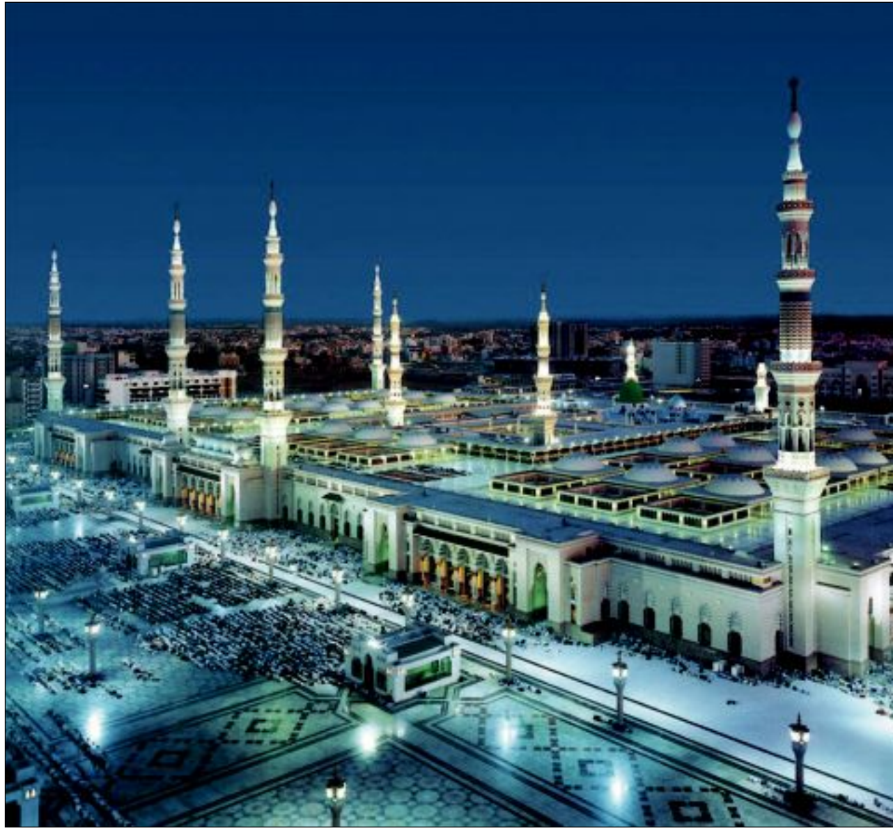
المسجد النبوي الشريف

ومع حلول ذكرى اليوم الوطني، أود أن أتقدم بالتهنئة إلى مقام خادم الحرمين الشريفين الملك عبدالله بن عبدالعزيز آل سعود وصاحب السمو الملكي ولي العهد نائب رئيس مجلس الوزراء وزير الدفاع الأمير سلمان بن عبدالعزيز آل سعود يحفظهما الله وإلى الأسرة المالكة المكرمة والشعب السعودي التبريل، داعياً الله عز وجل أن يحفظ المملكة العربية السعودية من كل مكروه وأن يعيد هذه المناسبة عليها بكل خير وعزة وأن يديم المولى عز وجل عليها وعلى شقيقتها دولة الكويت وعلى الأمتين العربية والإسلامية نعم الأمن والاستقرار والرخاء، وأن يحفظ لدولتنا خادم الحرمين الشريفين الملك عبدالله بن عبدالعزيز آل سعود وشقيقه حضرة صاحب السمو أمير البلاد الشيخ صباح الأحمد الجابر الصباح يحفظهما الله.