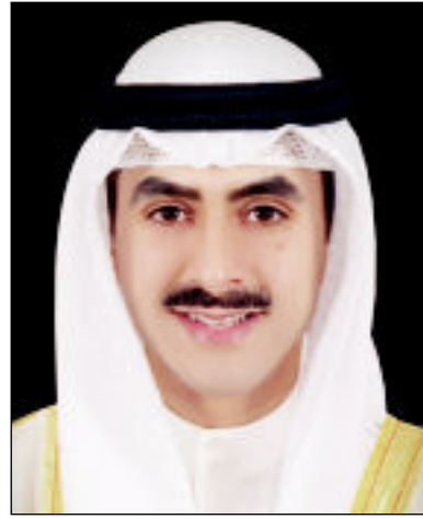
ثامر جابر الأحمد

وبين أن المملكة «حققت منذ تاريخ التأسيس مكاسب كبيرة على طريق التقدم والأمن والاستقرار والتنمية الاقتصادية ومواكبة التطورات المتسارعة في أنحاء العالم كافة».