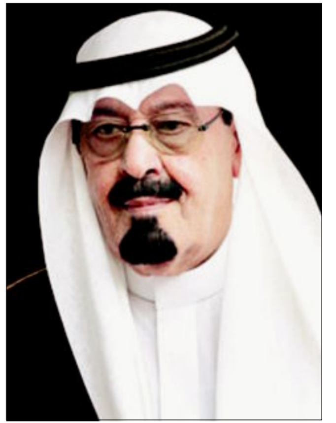
خادم الحرمين الشريفين الملك عبدالله بن عبدالعزيز