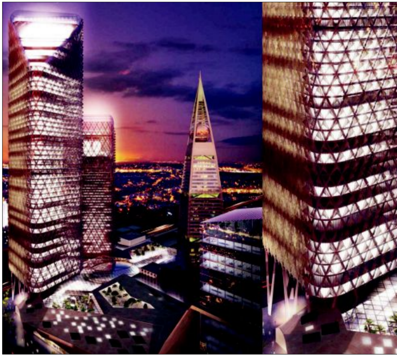
السعودية تواصل السير في طريق النهضة والتنمية