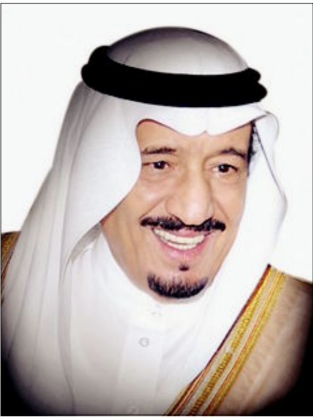
ولي العهد الأمير سلمان بن عبدالعزيز

23 سبتمبر ... ذكرى متجددة لمحنة وطنية تجسد قوة الترابط بين القيادة والمواطن