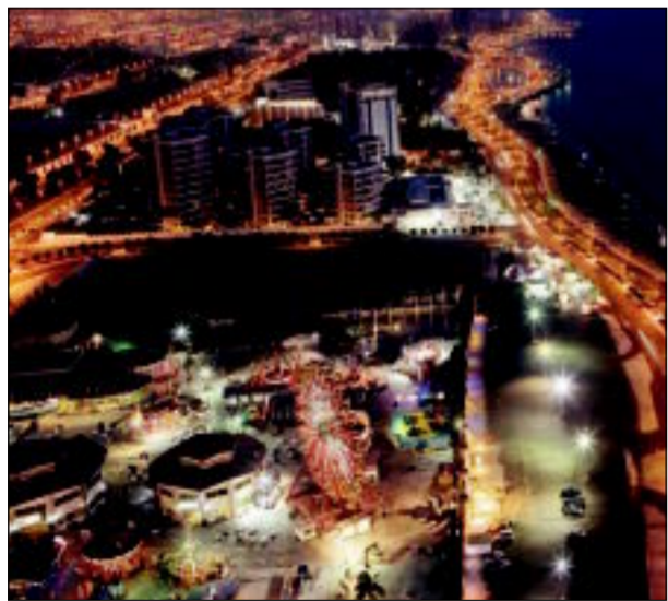
نهضة تنمية في جميع أنحاء المملكة

تحل اليوم الذكرى الـ 82 لليوم الوطني للمملكة العربية السعودية والشعب السعودي ينعم بالأمن والاستقرار ويشهد ملحمة وطنية تجسد قوة الترابط بين القيادة والمواطن. وفي مثل هذا اليوم من عام 1351هـ سجل التاريخ مولد المملكة العربية السعودية بعد ملحمة البطولة التي قادها المؤسس الملك عبد العزيز بن عبد الرحمن آل سعود - طيب الله ثراه - على مدى اثنين وثلاثين عاماً بعد استردادته لمدنية الرياض عاصمة ملك أجداده وإبائه في الخامس من شهر شوال عام 1319هـ الموافق 15 يناير 1902م، حيث صدر في 17 جمادى الأولى 1351هـ مرسوم ملكي بتوحيد كل أجزاء الدولة السعودية الحديثة تحت اسم المملكة العربية السعودية، واختار الملك عبدالعزيز يوم الخميس الموافق 21 جمادى الأولى من نفس العام الموافق 23 سبتمبر 1932م يوماً لإعلان قيام المملكة العربية السعودية. 82 عاماً حافلة بالإنجازات على هذه الأرض الطيبة والتي وضع لبناتها الأولى الملك المؤسس وواصل أبنائه تحقيق الإنجازات المتواصلة سياسياً واقتصادياً وتنموياً في المملكة لتجسد مسيرة البناء والرخاء للدولة الفتية وتتواصل في عهد خادم الحرمين الشريفين الملك عبدالله بن عبدالعزيز ونائبه وسمو ولي عهده الأمين الأمير سلمان بن عبدالعزيز آل سعود. ويأتي الاحتفال بذكرى اليوم الوطني والمملكة تعيش واقعا جديداً، خطط له خادم الحرمين الشريفين الملك عبد الله بن عبدالعزيز آل سعود،