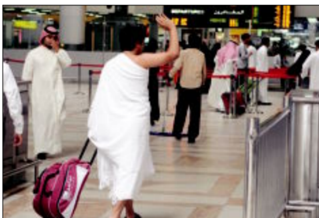
في أمن الله