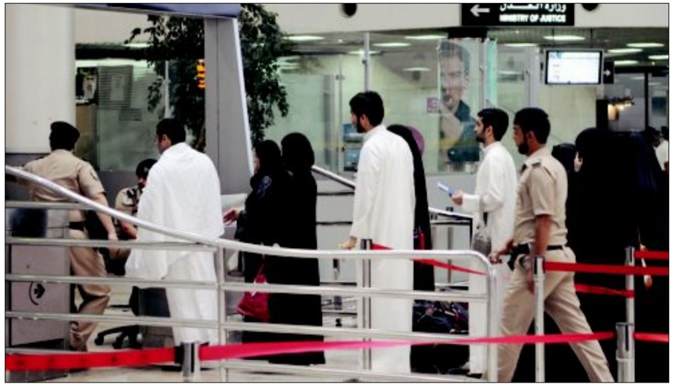
لا زحام أمام الكاونترات

لا ازدحام ملحوظاً عند انطلاق الرحلات... والإجراءات ممتازة وكذلك التنظيم