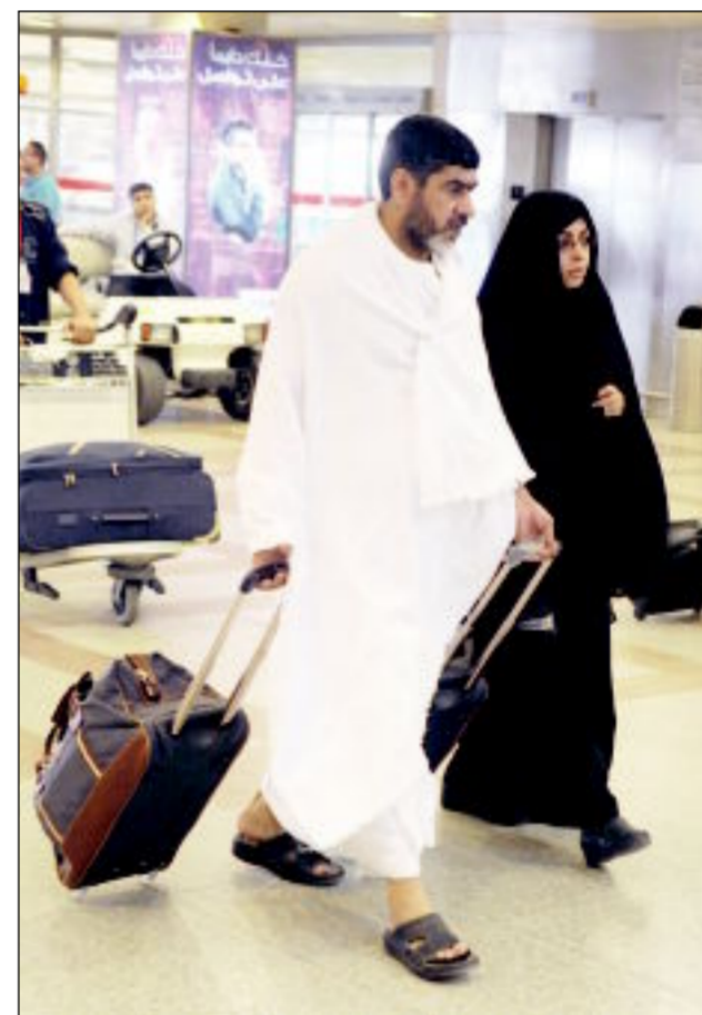
«بليك اللهم بليك»