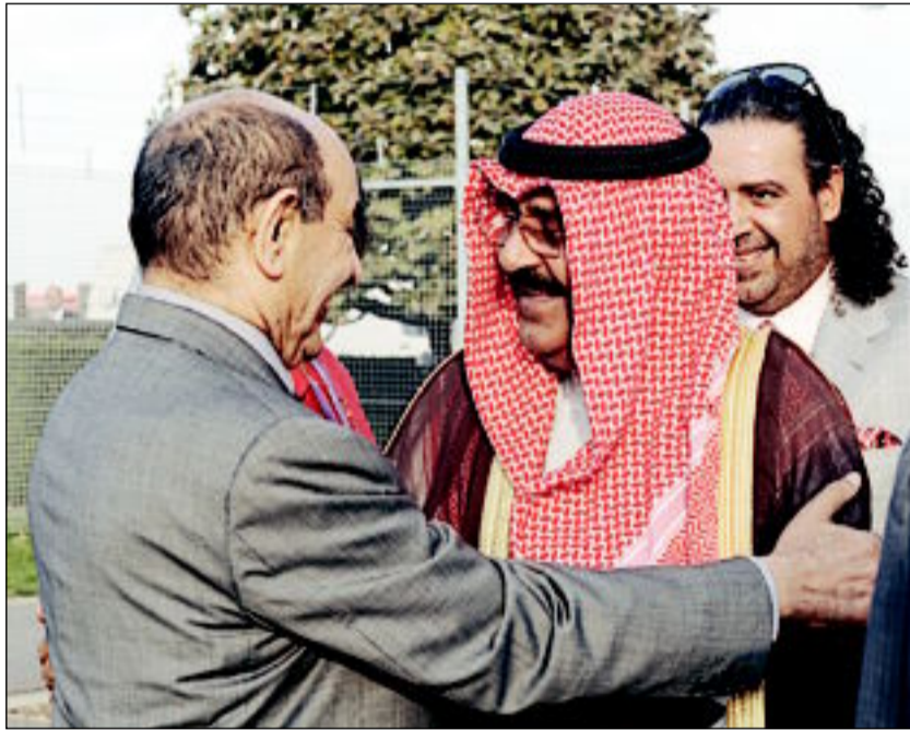
... ورئيس «الأمة» مرحبا بمشعل الأحمد ويبدو أحمد الفهد

كويتا - وصل صاحب السمو أمير البلاد الشيخ صباح الأحمد، برفقة نائب رئيس الحرس الوطني الشيخ مشعل الأحمد والوفد المرافق لسموه صباح أمس إلى مطار هيثرو الدولي بالمملكة المتحدة قادماً من الولايات المتحدة الأمريكية وذلك في زيارة خاصة. وكان في استقبال سموه، على أرض المطار رئيس مجلس الأمة جاسم الخرافي، ونائب رئيس مجلس الوزراء وزير الداخلية الشيخ أحمد الحمود، ونائب رئيس مجلس الوزراء وزير العدل وزير الشؤون الاجتماعية والعمل الدكتور محمد العفاسي، وسفير الكويت لدى المملكة المتحدة خالد عبدالعزيز الدويسان ورؤساء المكاتب الكويتية المعتمدة في المملكة المتحدة وأعضاء السفارة.