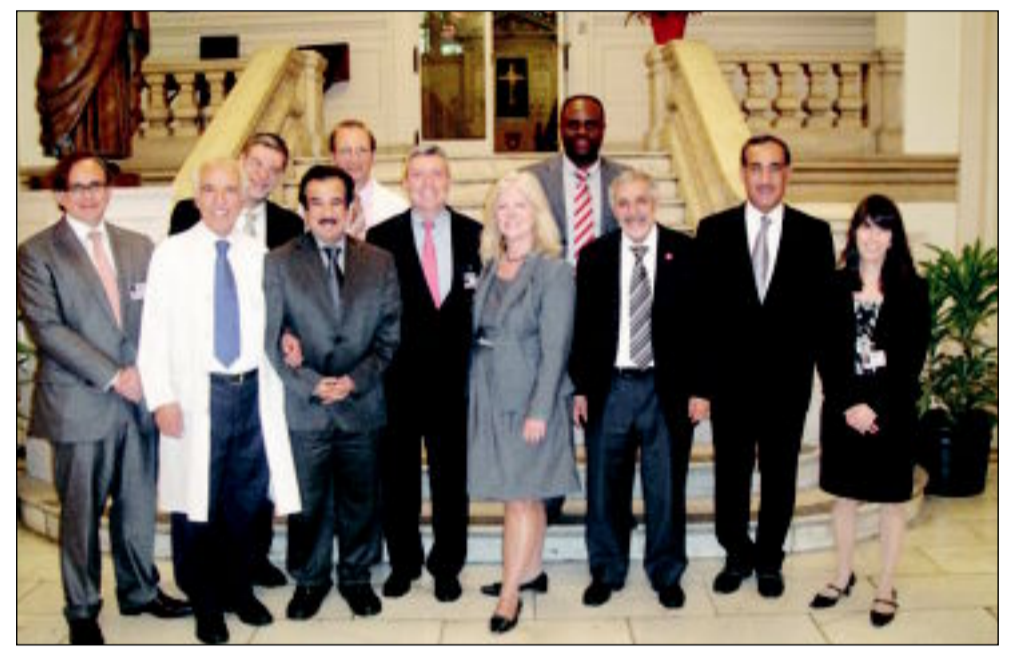
السائر في مستشفى «سانت لوكس»

كويتا - زار وزير الصحة الدكتور هلال السائر، مستشفى سانت لوكس روزفلت بجامعة كولومبيا بمدينة نيويورك الأمريكية أمس للوقوف على أحدث المتجدات المتعلقة بتنفيذ مشروع معهد الصباح لعلاج حالات عدم انتظام ضربات القلب بتبرع كريم من صاحب السمو أمير البلاد الشيخ صباح الأحمد. وتفقد السائر والوفد المرافق له معظم أقسام المشروع للناك من حسن سيره واستمع إلى شرح تفصيلي من المدير التنفيذي للمستشفى فرانك كراوليتشي، ومدير المشروع لمراحله وإلى تبيان المعوقات التي تعترض تنفيذها. وأبدى الوزير السائر في هذا الصدد استيائه من التأخر في تنفيذ المشروع وعدم ورود التقارير الدورية عن مراحل تنفيذها، مؤكداً أهمية التنسيق المتكامل بين