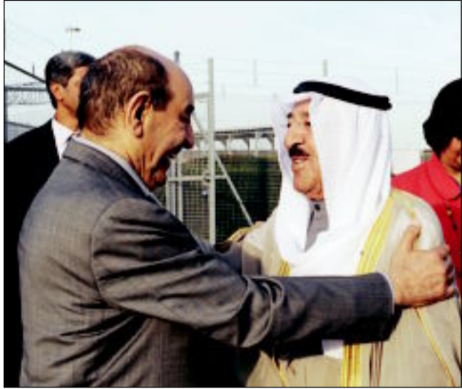
...ولدى وصول سموه لندن والخرافي مرحبا به

كويتا - بعث صاحب السمو أمير البلاد الشيخ صباح الأحمد، برفقة تهينة لأخيه خادم الحرمين الشريفين الملك عبدالله بن عبدالعزيز آل سعود ملك المملكة العربية السعودية، عبر فيها عن خالص تهنائه بمناسبة اليوم الوطني المجيد للمملكة العربية السعودية، مشيداً سموه بما حققت المملكة العربية السعودية الشقيقة من إنجازات حضارية شملت مختلف الميادين، وتمنيتها لأخيه خادم الحرمين الشريفين موفور الصحة والعافية ولللملكة العربية وشعبها الكريم كل الرفعة والتقدم والازدهار في ظل قيادته الحكيمة. وبعث سموه برفقة تهينة إلى الرئيس مالا مكاى سنها رئيس جمهورية غينيا بيساو الصديقة عبر فيها سموه عن خالص تهنائه بمناسبة العيد الوطني لبلادها، متمنياً لفخامته موفور الصحة ودوام العافية. كما بعث سمو الشيخ ناصر المحمد رئيس مجلس الوزراء برفقتي تهينة مائلتين. وبعث رئيس مجلس الأمة، جاسم الخرافي برفقة تهينة إلى رئيس مجلس الشورى السعودي عبد الله بن محمد آل الشيخ، بمناسبة العيد الوطني لبلادها.