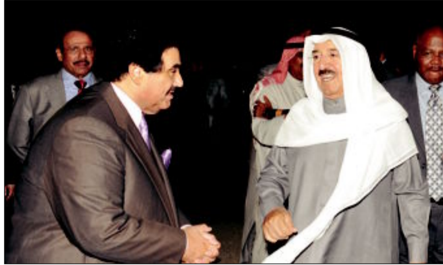
سمو الامير مغادر نيويورك وناصر المحمد في وداعه