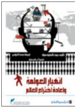
غلاف الكتاب الفائز

فاز كتاب «انهيار العولمة وإعادة اختراع العالم» لجنون راستون سول الصادر عن الدار المصرية - اللبنانية في القاهرة وترجمته من الانكليزية محمد الخولي بجائزة خادم الحرمين الشريفين الملك عبدالله بن عبدالعزيز آل سعود العالمية للترجمة، في دورتها الثالثة في مجال العلوم الانسانية من اللغات الأخرى إلى اللغة العربية.