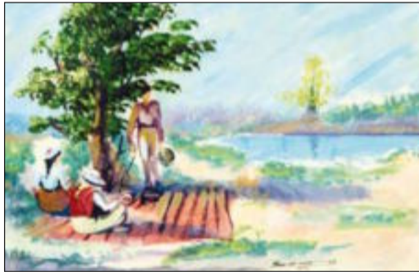
من أعمالها الفنية

الحياة جميلة واكمل ما فيها انا نزورها ونسرح في مساحاتها، ونعترف على ذواتنا عبر مرآة الآخر المتمثل في المكان والانسان.