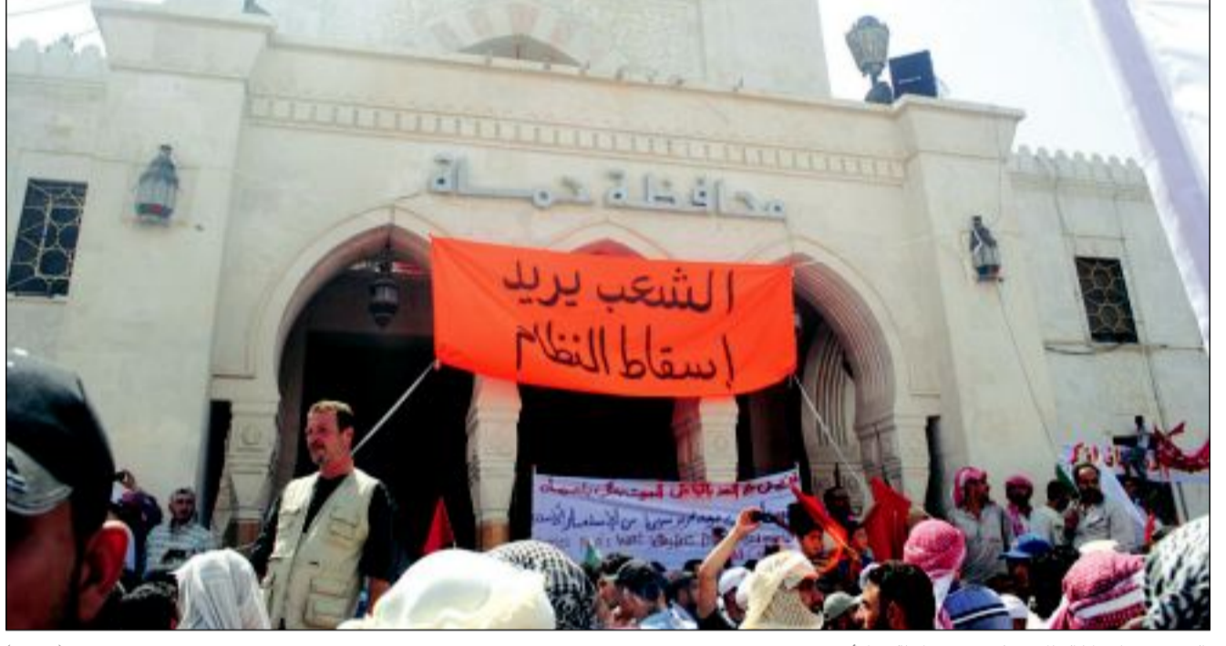
«الشعب يريد إسقاط النظام»... على مبنى محافظة حماة أسس