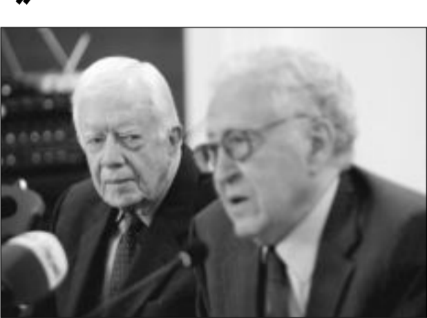
كارتر مستمعاً إلى الإبراهيمي في الخرطوم

الخرطوم - ا ف ب، رويترز - أكد الرئيس الأميركي السابق جيمي كارتر في الخرطوم الأحد ان السودان أعلن استعداده لسحب جنوده من منطقة اببيي المتنازع عليها.