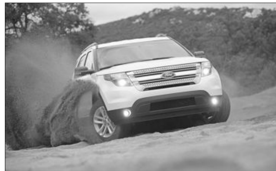
«فورد اكسبلورر 2011»

تمت إعادة تصميم فورد اكسبلورر 2011 بشكل جذري لتعكس الرؤية المعاصرة لمطلبي العملاء عند اختيارهم سيارة الدفع الرباعي متعددة الاستخدامات.