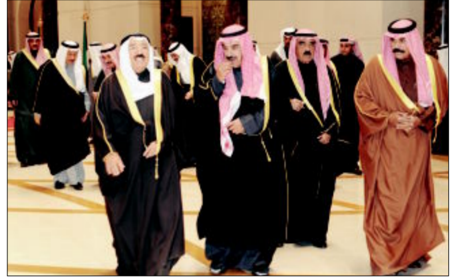
سمو الأمير لدى عودته إلى البلاد

وأكد المجلس الأعلى على دعم مسيرة التنمية في اليمن، وتعزيز أطر التعاون بين مجلس التعاون والجمهورية اليمنية، واندماج الاقتصاد اليمني في الاقتصاد الخليجي.