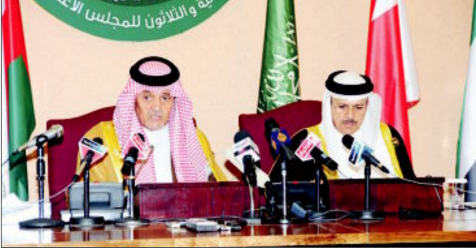
سعود الفيصل والزباني في المؤتمر الصحافي

○ قرارات القمة عكست استشرار القيادة الخليجية لمسؤولياتها أمام المرحلة الحالية