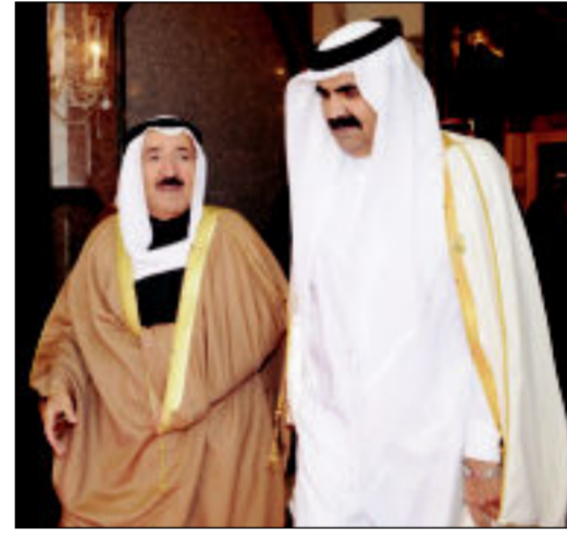
حديث بين صاحب السمو وأمير قطر

وكان في استقبال سمو الأمير لدى عودته إلى أرض الوطن مساء امس سمو ولي العهد الشيخ نواف الاحمد وكبار الشيوخ ونائب رئيس الحرس الوطني الشيخ مشعل الاحمد وسمو الشيخ ناصر المحمد ورئيس مجلس الوزراء الشيخ جابر المبارك ونائب وزير شؤون الديوان الأميري الشيخ علي الجراح والوزراء وكبار المسؤولين في الدولة وكبار القادة في الجيش والشرطة والحرس الوطني. وكان في وداع سمو الأمير على ارض مطار قاعدة الرياض الجوية لدى مغادرته السعودية الدكتور توفيق بن فوزان الربيعية وزير التجارة والصناعة رئيس بعثة الشرف المرافقة والقائم باعمال سفارة الكويت لدى الرياض بالانابة ذياب فرحان الرشيد.