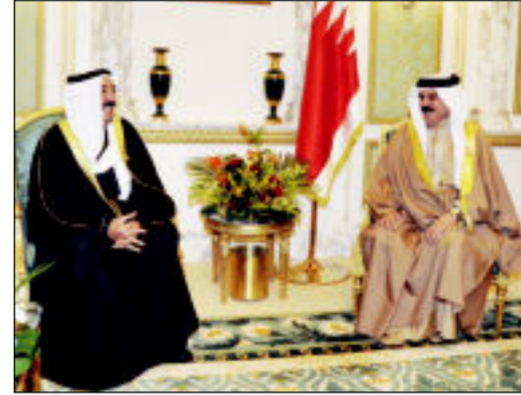
صاحب السمو وحمد بن عيسى في الرياض

كونا - بعث صاحب السمو أمير البلاد الشيخ صباح الاحمد بقرعة شكر إلى خادم الحرمين الشريفين الملك عبدالله بن عبدالعزيز آل سعود ملك المملكة العربية السعودية، اعرب فيها سموه عن خالص الشكر والتقدير على الحفاوة البالغة وكرم الضيافة التي حظي بهما والوفد المرافق خلال مشاركة سموه في اعمال الدورة الثانية والثلاثين للمجلس الأعلى لدول مجلس التعاون لدول الخليج، سائلاً سموه المولى تعالى ان تكفل اعمال هذا اللقاء الأخوي المبارك بالتوفيق والسداد لتعزيز اواصر التعاون وتوطيد العلاقات بين دول المجلس وتحقيق تطلعاتها وخدمة قضايا الأمتين العربية والإسلامية، مبتهلاً سموه الى الباري جل وعلا ان يديم على خادم الحرمين الشريفين موفور الصحة والعافية وان يحقق للمملكة العربية السعودية الشقيقة وشعبها الكريم المزيد من الرفعة والازدهار في ظل قيادته الحكيمة.