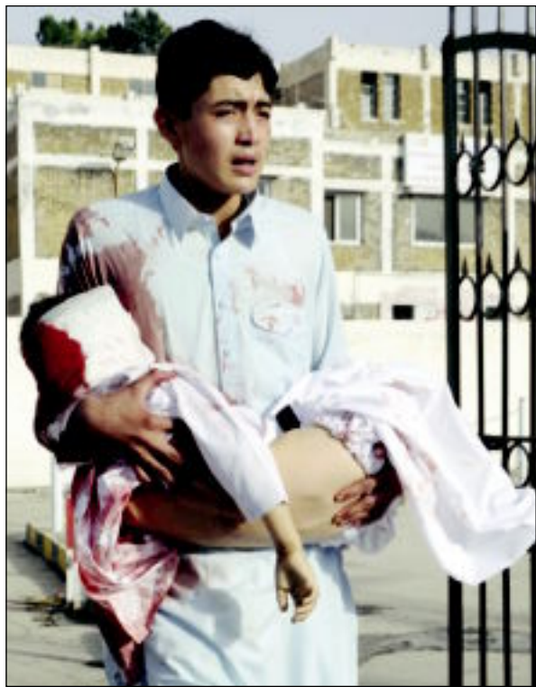
فتى باكستاني يحمل أحد ضحايا تفجير كويتا

الارجح وليس هناك «اي معلومات» في الوقت الحاضر حول التاريخ الذي قد تفتح فيه مجددا. وتابعت: «سنواصل تقييم المعلومات حول الخطر ونتخذ القرارات المناسبة». ورغم تحالف اسلام اباد مع واشنطن في «الحرب على الارهاب»، الا ان مشاعر العداة للولايات المتحدة تنتشر في باكستان وتساهم في تاجيحتها الغارات التي تشنها الطائرات الاميركية من دون طيار مستهدفة ناشطين اسلاميين في المناطق الاصلية في باكستان.