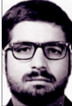
...وفي ثياب الجامعة متخرجاً في غلاسكو