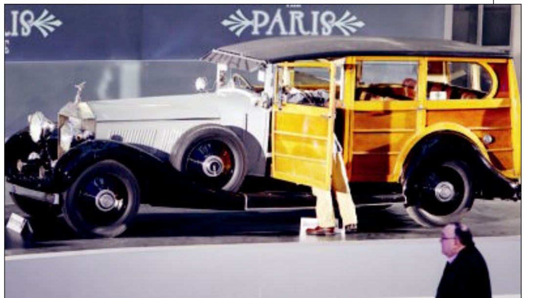
...رولزرويس فانتوم 1 صنعت عام 1928

من طرازات شهيرة، من بينها «بينتلي» و«رولزرويس» وغيرهما من الماركات القديمة التي تعتبر تراثاً ثميناً في عالم السيارات.