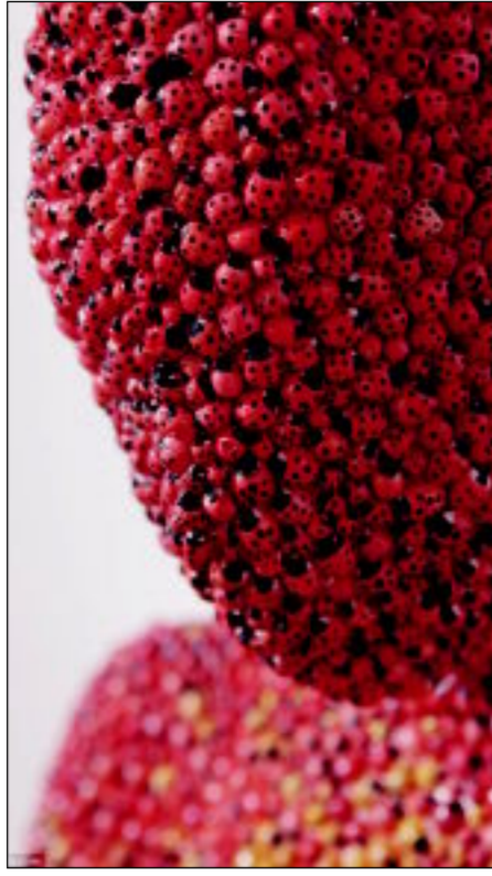
وجه منحوتة «العسوقة»