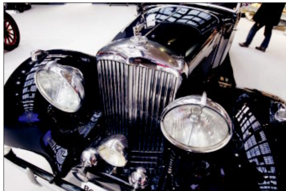
...بينتلي طراز 1938