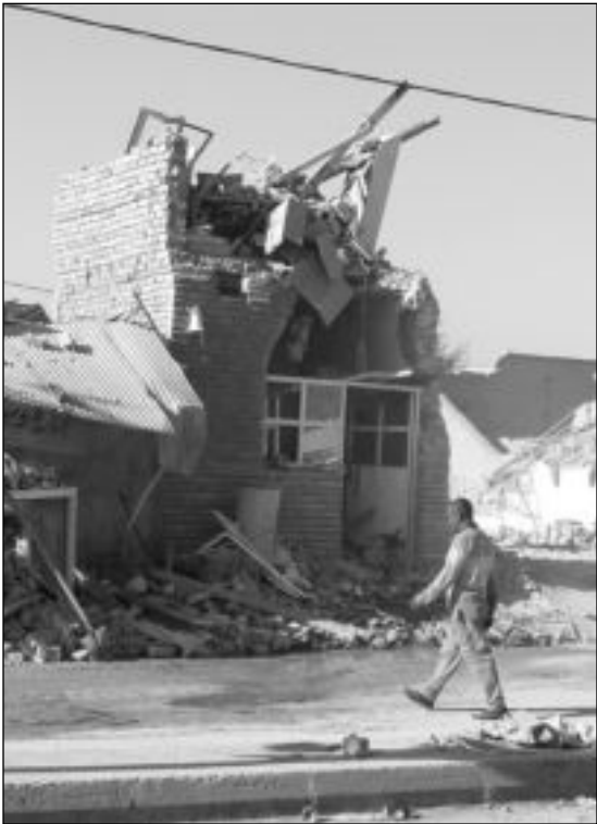
عراقيا يمر أمام «مسجد الحسين» المنمر الذي استهدفه انتحاري في قضاء المسيب

الماضية وإشعال الحرب الأهلية في العراق لن تحقق أهدافها المظلمة»، كما نددت تركيا بالطبيعة اللا إنسانية» للفتجيرات التي استهدفت مساجد ومجالس العزاء.