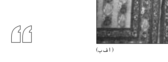
(أ ف ب)

البرنامج النووي الإيراني»، معتبرا ان «الجهود الدبلوماسية لحل الخلاف في شأن البرنامج النووي الإيراني قد تسفر عن اتفاق في غضون الإطار الزمني الذي دعا إليه الرئيس روحاني من ثلاثة إلى ستة أشهر».