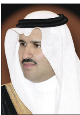
الأمير فيصل بن سلمان

المدينة المنورة - سالم الأحمد ■ عبر صاحب السمو الملكي الأمير فيصل بن سلمان بن عبدالعزيز، أمير منطقة المدينة المنورة عن سعادته لانطلاق فعاليات المهرجان الوطني للتراث والثقافة في دورته الثلاثين. وأكد سموه بهذه المناسبة ان رعاية خادم الحرمين الشريفين الملك سلمان بن عبدالعزيز لهذا المهرجان وبحضور نخبة من كبار الشخصيات ورجال العلم والفكر تعتبر تفعيلًا لهذا الحدث الثقافي العربي البارز ودعمًا كبيرًا لأهدافه وأبعاده.