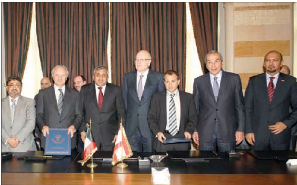
عبد الوهاب البدر ونجيب ميقاتي يتوسطان جبران باسيل ومحمد الصفدي عقب توقيع اتفاقية القرض