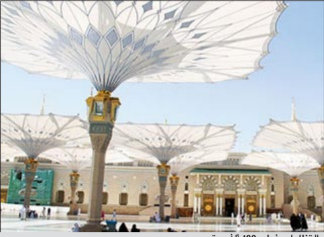
التظليل يغطي 100 ألف متر مربع