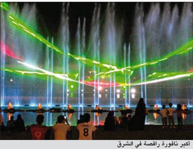
أكبر نافورة راقصة في الشرق

العربية.نت: كشف نائب الرئيس العام لشؤون المسجد الحرام مكة في تظليل ساحات الحرم المكي بـ 8 مظلات ضخمة، و42 مظلة متوسطة، ضمن مشروع توسعة الملك عبدالله للساحات الشمالية، يجري تنفيذها حاليا وفق طراز عمراي فريد. وكشف نائب الرئيس العام لشؤون المسجد الحرام د.محمد بن ناصر الخزيم أن المظلات الثماني ستكون بمقاس 53 × 53م، فيما ستكون المظلات الأخرى بمقاس 25 × 25م، مشيرا إلى أن المشروع سيحتوي على 4 جسور تصل بين توسعة الملك عبدالله والتوسعة السعودية الأولى والجسر الخامس الذي يصل بين توسعة الملك عبدالله مع المسعى، كما قالت صحيفة «عكاظ» السعودية. وأكد د.الخبزيم أن المشاريع التي يجري العمل على إنجازها على مدار الساعة ستشمل أحدث وأرقى النظم الكهربائية والميكانيكية، وستكون متناسقة مع الطراز المعماري الحالي للمسجد الحرام، كما تشمل مباني التوسعة والساحات المحيطة بها والجسور المعدة لتفريغ الحشود وترتبط بمصاطب متدرجة، وتلي التوسعة جميع الاحتياجات والتجهيزات