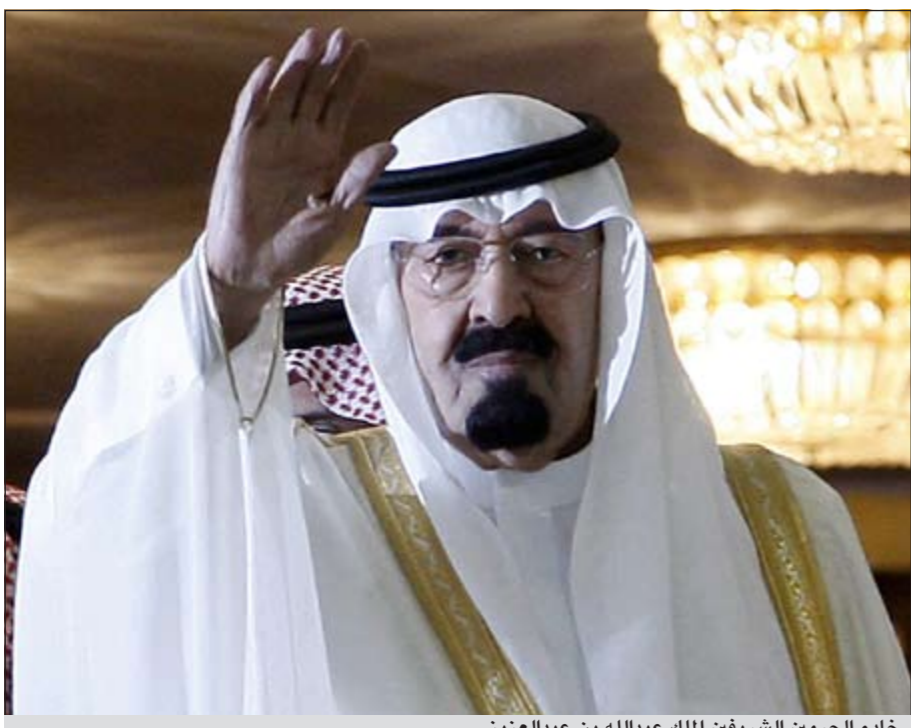
خادم الحرمين الشريفين الملك عبدالله بن عبدالعزيز

الرياض - العربية.نت: تلقت 14 وزارة خدمية في السعودية أوامر مشددة من خادم الحرمين الشريفين الملك عبدالله بن عبدالعزيز بضرورة الحرص على تطوير الخدمات التابعة لها، وتقديمها لكل محتاج من المواطنين، وتلافي أي قصور». وقالت صحيفة «عكاظ» التي أشارت إلى نص الخطاب إن الوزارات التي خاطبها خادم الحرمين الشريفين هي: التربية والتعليم، والشؤون البلدية والقروية، والشؤون الإسلامية والأوقاف والدعوة والإرشاد، والتعليم العالي، والزراعة، والنقل، والاتصالات وتقنية المعلومات، والمياه والكهرباء، والشؤون الاجتماعية، والصحة، والعمل، والإسكان، والخدمة المدنية، والتجارة والصناعة. يذكر أن خادم الحرمين كان قد شدّد أيضاً قبل أيام على سفير المملكة بأهمية خدمة الشعب وعدم التهاون في خدمة أي سعودي، وقال «انتم ونحن كلنا في خدمة الشعب السعودي، ولهذا لازم لازم ألا تتهاونوا في خدمة أي سعودي، تحدث له قضية أو حادثة أو أمر آخر، فيجب أن تباشروها حالاً، ولا بد أن تضعوا في بالكم الصغير والكبير ولا يوجد فرق بين وزير أو أمير أو أقصى الشعب وهذه في ذمتكم، من ذمتي في ذمتكم، وساحاسبكم عليها والله سيحاسبكم عليها».