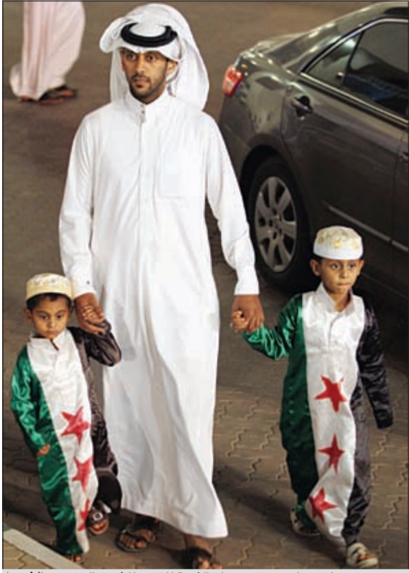
سعودي يصطحب ولديه مرتدين علم الثورة للتبرع للشعب السوري

وقى وقت لاحق، أوردت وكالة الأنباء السعودية أن إجمالي التبرعات النقدية المقدمة للحملة في يومها الأول تجاوز 121,771 مليون ريال، مشيرة إلى أن الحملة استقبلت التبرعات العينية من مواد غذائية وطبية وأدوية وملابس وخيام وبطانيات واغطية وجوهرات. وأعلن موقع الحملة الوطنية السعودية لإغاثة الشعب السوري على الإنترنت أن مبلغ التبرعات