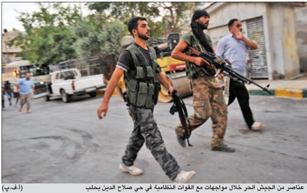
عناصر من الجيش الحر خلال مواجهات مع القوات النظامية في حي صلاح الدين بحلب

مع فرانس برس أمس أن «الجيش النظامي يسيطر على المزة وببزة والميدان وكفرسوسة بشكل كامل»، مشيراً إلى أن هذه الأحياء «لا تشهد اشتباكات بل تظاهرات وحملات دهم يومية». وأضاف أن «النظام دخل العسالي ونهر عسلة (جسور)، لكنهما تشهدان اشتباكات مقطعة». وقال أن «المقاتلين المعارضين مازالوا في حالة دفاع ولم يشنوا أي هجوم مضاد منذ أن بدأ الجيش النظامي هجومه لاستعادة السيطرة على دمشق قبل ثلاثة أيام». ومن جهتها قالت اللجان والهيئة أن الحملة التي نفذها الجيش النظامي أمس تركت إلى جانب حلب ودمشق على حماة وحمص وادلب ودير الزور واللاذقية وأسفرت عن سقوط أكثر من 46 شخصاً بينهم أطفال وجنود منشقون حتى عصر أمس. وأضافت أن عدة مدن سورية منها حمص ودرعا ودمشق وادلب وحماة واللاذقية تعرضت للقصف مدفعي عنيف ترافق مع انفجارات واشتباكات بين القوات النظامية ومقاتلين معارضين.