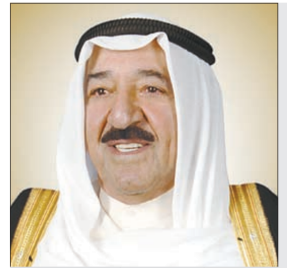
صاحب السمو الأمير الشيخ صباح الأحمد

في تحرك سريع لمواجهة موجة الانقسامات التي تعرضت لها كثة الأغلبية، أكدت مصادر مطلعة من «الأغلبية» أن اتصالات ومشاورات يجريها الأعضاء البارزون في الكثرة لرأب الصدع وإنهاء بعض الخلافات الكارثية نتيجة التباين في الرؤى حول بيان أولويات الأغلبية ومشروعها للإصلاح السياسي، وفي سياق الموضوع تلتقي الجماعات الشبابية اليوم بديوان رئيس