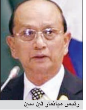
رئيس ميانمار أون سين

وأضاف: بورما ستحتل مسؤولية الجنسية الاثنية ولكن من المستحيل أن تعترف بالروهنجيا «وهي الأقلية المسلمة» الذين ليسوا مجموعة اثنية في ميانمار. وقال إنه كمالا أخير، حكومته مستعدة لتسليم الروهنجيا إلى مفوضية اللاجئين وأن تقيم مخيمات لهم قبل أن يستقروا في النهاية في بلد ثالث «يكون مستعدا