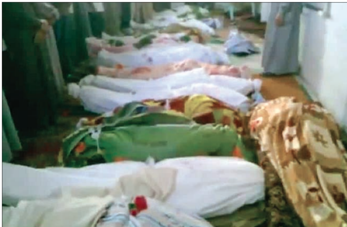
صورة بثها ناشطون لجنث ضحايا مجزرة التريسة

معارضين وقوات الأمن في مخيم البرموك الفلسطيني وسط إطلاق نار كثيف وإغلاق كامل لطريق شارع فلسطين.