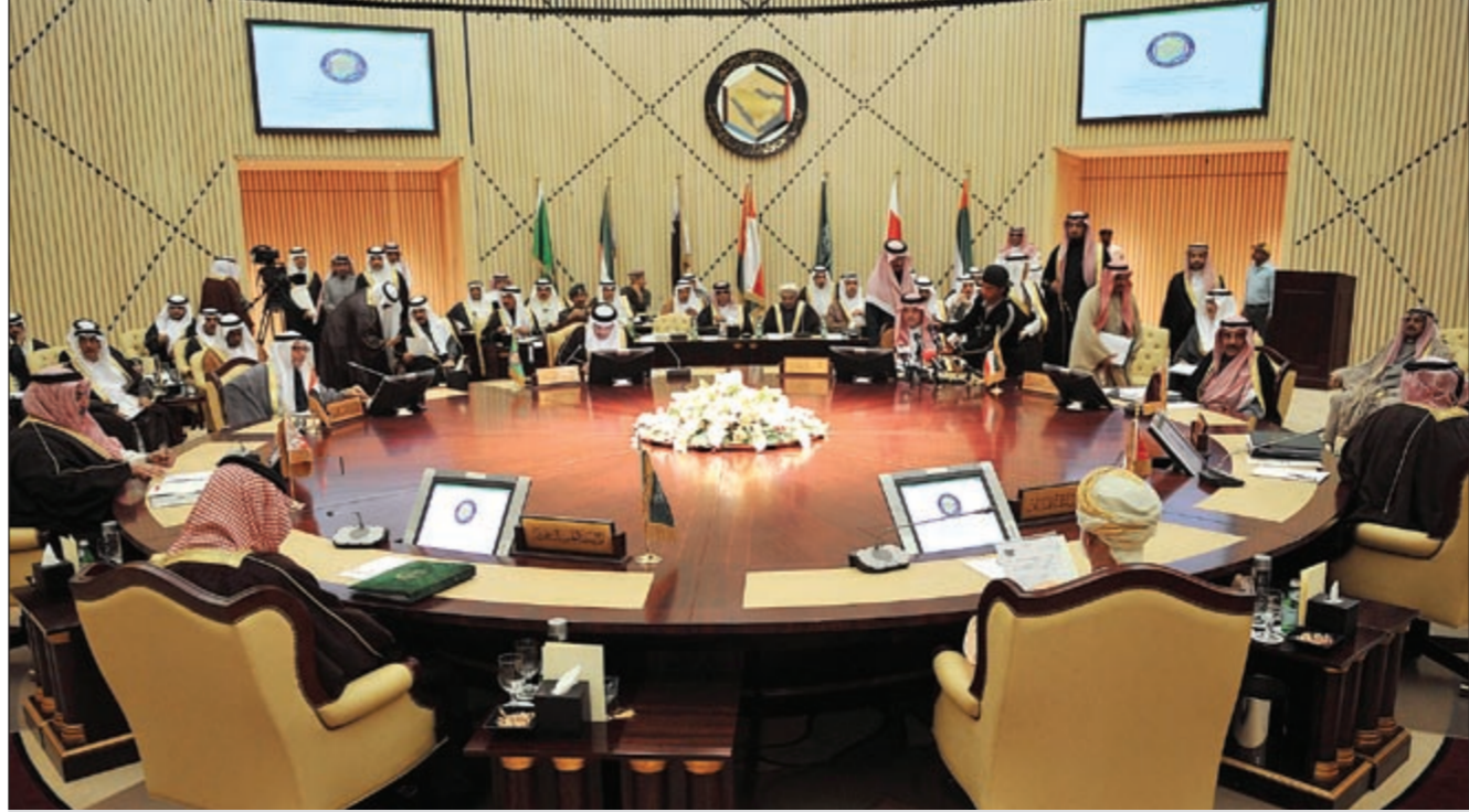
جانب من الاجتماع الوزاري الخليجي في الرياض

الرياض أمس وذلك للمشاركة في الاجتماع الوزاري الخليجي في دورته العادية (122).