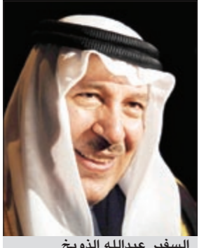
السفير عبدالله الذويخ