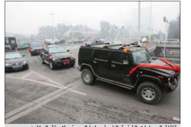
قافلة السيارات الفخمة التي أرسلها الصيني لاستقبال كلبه

وكالات: قام ثري صيني يملك مزرعة كلاب من نوع «ماستيف» في إحدى المدن الواقعة في شمال الصين بانفاق 3 ملايين يين صيني أي ما يعادل 450000 دولار من أجل شراء كلب من الفصيلة السابق ذكرها. وقد قام هذا الشخص بإرسال 20 سيارة فخمة تتضمن انواع «بورش - مرسيدس - بي ام دابيو - وشاحنات من نوع هامر» تم تزئینها جميعا بوشاح أحمر لنقل الكلب من المطار بالإضافة الى فرش سجاد احمر ليسير عليه الكلب! ويقول الثري ان الكلب من دماء صافية ونبيلة وهذا سر المبلغ الضخم الذي دفعه مقابل الكلب وقد جذب الاستثمار المكي للكلب وسائل الاعلام الصينية لتغطية الحدث.