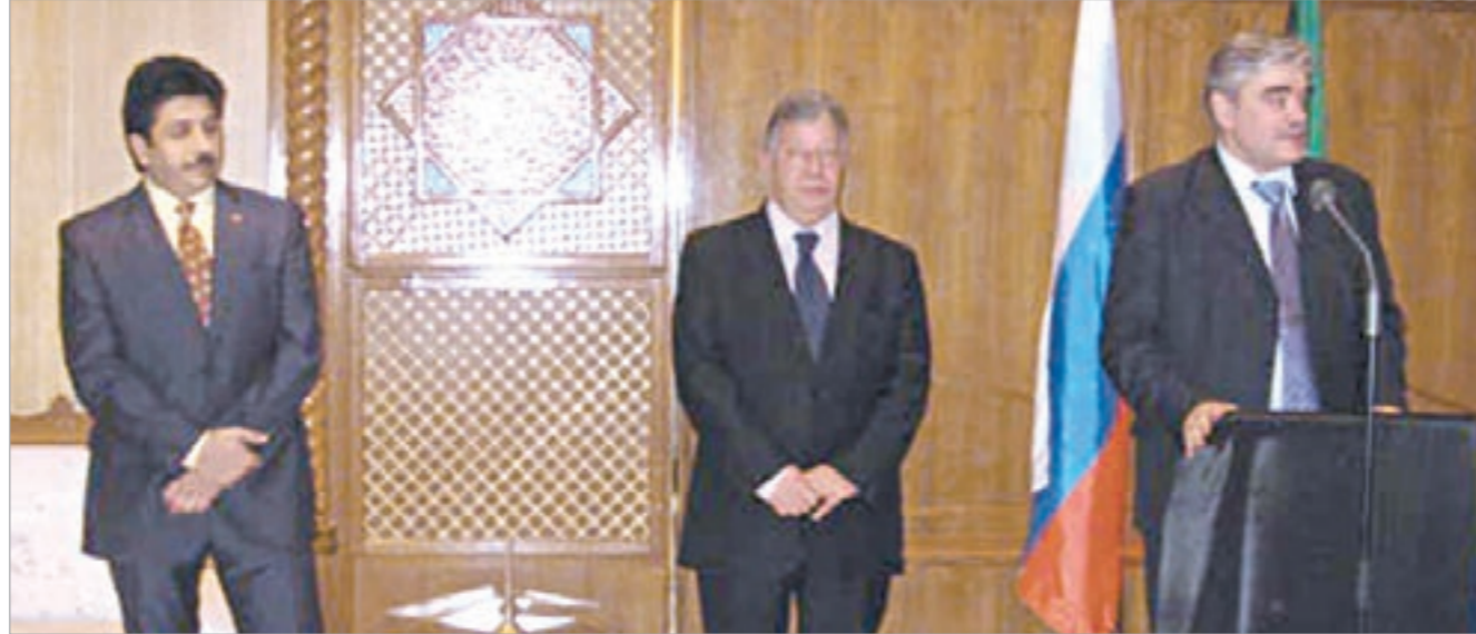
مستشار الرئيس الروسي الكسي غريشين يلقي كلمته

كلمة ألقاها بهذه المناسبة بالدور الذي يلعبه د.الفلاح في مجال الفكر والثقافة وعمل الخير. وقال أن تكريم د.الفلاح يعتبر تكريماً لجميع المسلمين من العرب أو الروس الذين يعملون في مجال نشر المحبة والسلام. وأضاف أن منحه د.الفلاح وسام الدولة الروسية للصداقة يدل على الاهتمام الكبير الذي توليه القيادة الروسية للمسلمين الروس، معرباً عن شكره وتقديره للقيادة الروسية على هذه الخطوة التي ستساهم في تعزيز العلاقات ليس فقط بين روسيا ودول مجلس التعاون الخليجي بل بين روسيا والعالم الإسلامي ككل. ورأى أن ذلك سيساهم أيضاً في تحقيق