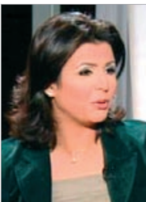
الاعلامية منى الشاذلي

الرياض- وكالات: أكد المفتي العام للمملكة العربية السعودية الشيخ عبدالعزيز آل الشيخ ان كتاب الصحف الذين يهاجمون فتوى أصدرتها اللجنة الدائمة للإفتاء أخيرا بتحريم عمل المرأة على صناديق القبض في المحال «كاشيرة» مخطئون. ونقلت جريدة «الحياة» اللندنية عن آل الشيخ ردا على سؤال عن نشر صحف انتقادات للفتوى المذكورة خلال درس القاه في جامع الشيخ إسن باز في حي العريزية بمكة المكرمة: «ما ينشره بعض أبنائي كتاب الصحف عن الفتوى وسوء فهمهم لها أو قلة ادراك بعضهم لحقيقتها، هذا أمر خطأ بلاشك، نسال الله ان يمن على الجميع بالهداية».