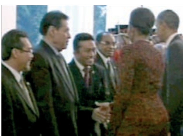
ميشيل تصافح وزير الاعلام الاندونيسي وتثير أزمة

الاندونيسية إن مشكلة تيفاتول، الموصوف بأنه واحد من المتشددين والمحافظين إسلاميا في اندونيسيا، بدأت حين أسرع بعض الوزراء في حكومة الرئيس الاندونيسي سوسيلو بامبانج يودويونو بمعاينته على ملامسة يدوية منافية برأيه هو بالذات لتقاليد المصافحات بين الرجل والمرأة، فأسرع ورد على معانيبه عبر صفحة له في موقع «تويتر» صفة له على الإنترنت فكتب «حاولت تجنبها لكنها مدت يدها تحوي طويلا، فكانت ملامسة سريعة»، طبقا لما قال.