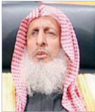
الشيخ عبدالعزيز آل الشيخ

وكانت بعض المراكز التجارية في مدينة جدة قد واصلت تشغيل عدد من الفتيات «كاشيرات» متجاهلة فتوى التحريم التي أصدرتها هيئة الافتاء السعودية بجهة منع الاختلاط. وواصلت الفتيات اللواتي يعرفن محليا بـ «الكاشيرات» العمل في بعض المحال التجارية بعد ستة أيام على الفتوى، والتي باتت تعرف بفتوى «تحريم الكاشيرات». وحرمت اللجنة الدائمة للبحوث العلمية والإفتاء السعودية، عمل المرأة «كاشيرة» بذلك قرار الوزارة العمل بهذا الشأن. وجاء في نص الفتوى، انه «لا يجوز للمرأة ان تعمل في مكان فيه اختلاط بالرجال، والواجب البعد عن مجامع الرجال، والبحث عن عمل مباح لا يعرضها للفتنة أو للافتتان بها».