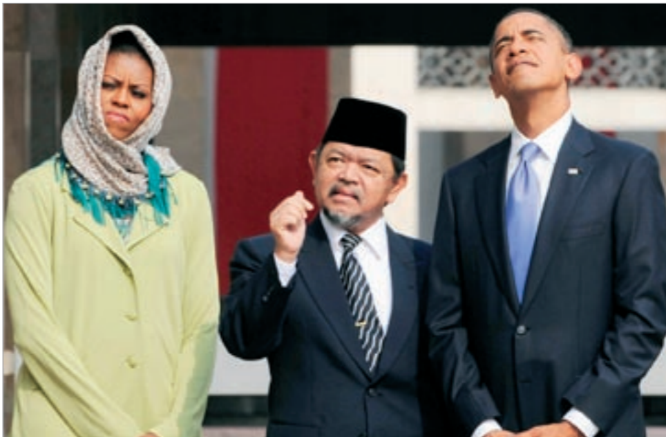
ميشيل وأوباما مع الامام الأكبر لمسجد الاستقلال باندونيسيا