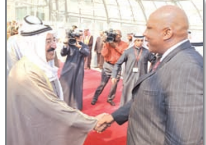
صاحب السمو الأمير الشيخ صباح الأحمد مستقبلاً ملك ليسوتو

مشارق ابوشادي أقر مجلس إدارة مجموعة «زين» في اجتماعه المطول امس بالإجماع، العرض الذي تقدمت به شركة «بهارتي» الهندية لشراء «زين» أفريقيًا بقيمة 10,7 مليارات دولار. وكشفت مصادر مطلعة لـ «الأنباء» أن شركة «بهارتي» تقدمت بعرضها منذ شهر، مشيرة إلى أن الشركة ستقوم بدفع نحو 10 مليارات دولار منتصف ابريل المقبل على أن تدفع 700 مليون دولار قبل نهاية العام. وأضافت المصادر أن الأرباح المتوقعة من الصفقة تقدر بما يعادل 3,5 مليار دولار (مليار دينار)، مشيرة إلى أن هناك توجهًا لعقد جمعية عمومية استثنائية للموافقة على توزيع جزء كبير من هذه الأرباح على المساهمين. وكان لهذه الصفقة تأثير قسوي على البورصة الكويتية امس والتي سجلت أرقامًا قياسية في كل مؤشراتهما والتي لم تشهدها منذ منتصف العام الماضي.