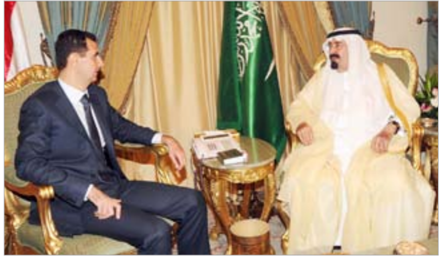
تحركات دبلوماسية كثيفة تمحورت حول لبنان وتمثلت بقمة سورية - سعودية في الرياض واستقبال الرئيس ميشال سليمان للمبعوث الأميركي جيفري فيلتمان ولقاء مسائي جمع السيد حسن نصرالله والنائب وليد جنبلاط

بيروت: لم يكد الرئيس الإيراني محمود أحمدني نجاد يغادر لبنان حتى أعلن عن زيارة لم تكن مقررة للرئيس السوري بشار الأسد إلى الرياض. وبدأ من تشكيلات الزيارة أنها تمت على عجل وأخذت صفة «زيارة عمل» إذ اقتصر على لقاء مطول في القاعة الملكية في مطار الرياض، واقتصر المحادثات على الرئيس الأسد وخادم الحرمين الشريفين الملك عبدالله ومستشاره الأمير عبدالعزيز بن عبدالله من دون ان يتسرب منها شيء، وترافقت زيارة الأسد التي الرياض مع الإعلان عن توجه الرئيس الحريري إلى العاصمة السعودية في زيارة خاصة ولم يجر أي لقاء بين الأسد والحريري هناك، وفي خلال الزيارة أيضاً، وصل مساعد وزير الخارجية الأميركية جيفري فيلتمان إلى بيروت قادماً من الرياض، وهو يقوم الآن بجولة في المنطقة لم يكن لبنان مرجحاً على برنامجها، ما عزز التساؤلات