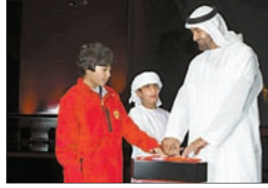
ولي عهد أبوظبي الشيخ محمد بن زايد يفتتح عالم فيراري أبوظبي - أكبر مدينة ترفيهية مغطاة بالعالم

افتتح ولي عهد أبوظبي نائب القائد الأعلى للقوات المسلحة الشيخ محمد بن زايد آل نهيان أكبر مدينة ترفيهية مغطاة من نوعها في العالم «عالم فيراري أبوظبي» من خلال الضغط على زر مصمم على شكل السقف المميز، معلناً الافتتاح الرسمي للمدينة وسط حضور نخبة من نجوم الرياضة والفن والإعلام، وضغط الشيخ محمد على زر الافتتاح الرسمي للمدينة ليتحول المكان إلى مسرح كبير حيث استعرضت اللوحات الراقصة لصابدي اللؤلؤ والموسيقى الحية، فيما انطلقت عبر سقف المدينة الترفيهية عروض رائعة للالعاب النارية أحالت سماء المدينة وجزيرة ياس إلى اطراف من الأضواء الملونة. التفاصيل ص 32