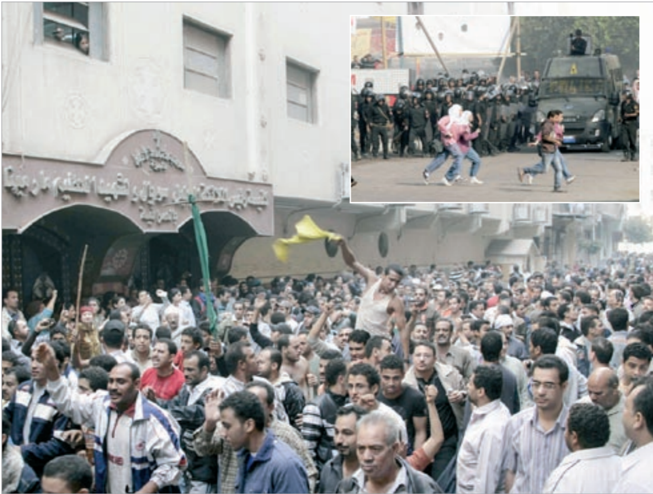
تظاهرة مسيحية أمام كنيسة مارمينا بالعمرائية احتجاجا على مقتل قبطني خلال اشتباكات مع قوات الأمن أمس وفي الأطار مصريون يغفرون من مكان الاشتباكات

الجيزة - أ.ش.أ: تمكنت قوات الأمن المصرية بمحاظة الجيزة من احتواء تظاهرة لنحو 3 آلاف متظاهر مسيحي أمس في محاولة منهم لاستكمال أعمال مجمع خدمات طبية واجتماعية وتحويله إلى مبنى كنسي رغم عدم الحصول على الترخيص النهائي باستكمال البناء ووجود مخالفات فنية وهندسية في عملية البناء، فيما تم إلقاء القبض على 93 من مثيري الشغب ومنتزعي الاعتداءات على المواطنين والشرطة خلال التظاهرة.