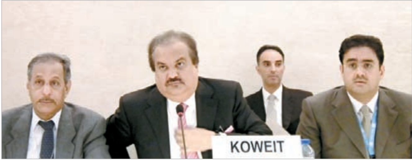
السفير ضرار الرزوقي متحدثاً أمام مجلس حقوق الإنسان في جنيف

مؤكداً ان أجهزة الدولة تحاول الوصول إلى جنسياتهم الأصلية ولكن ورغم عدم تعاونهم وقيام العديد منهم بإخفاء المستندات التي تثبت هويتهم خشية حرمانهم من بعض المزايا التي يحصلون عليها حالياً فإن الكويت قامت بتقديم كل التسهيلات الإنسانية لهذه الفئة من المقيمين على أراضيها وتوفير سبل الرعاية لهم خاصة في مجالي التعليم والصحة».