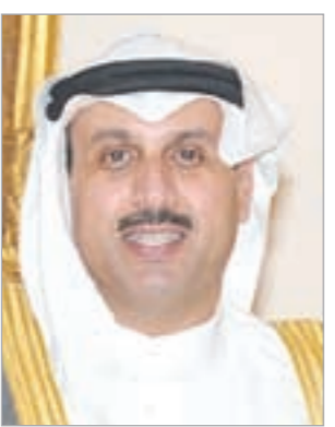
السفير الشيخ حمد جابر العلي

الرياض - كونا: أكد سفيرنا لدى المملكة العربية السعودية الشيخ جابر العلي حرص القيادتين الكويتية والسعودية على تواصل شعبيهما وبينهما. وقال الشيخ حمد الجابر لـ «كونا» أمس عقب توقيع الكويت والمملكة العربية السعودية اتفاقية تهدف إلى تنقل مواطنيها بالطائرة الكعبة بين البلدين من دون استخدام جواز السفر ان صاحب السمو الأمير الشيخ صباح الأحمد وأخاه خادم الحرمين الشريفين الملك عبدالله بن عبدالعزيز يشدان دائماً على التواصل بين البلدين والشعبين الشقيقين. وأضاف ان هذه الاتفاقية ستدخل في نفوس الشعبين