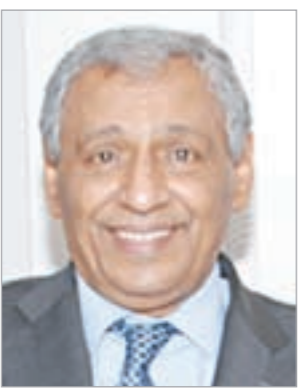
السفير خالد الدويسان

البريطاني القضايا التي طرحها السفراء الخليجيون نيابة عن دولهم ما يؤكد مدى عمق هذه العلاقات التاريخية بين الجانبين. وقال ان الجانبين اتفقا على عقد اجتماعات لاحقة بهدف مواصلة السعي لتطوير الجوانب المختلفة لعلاقتهم. وذكر الدويسان ان الاجتماع اهتمتاهما أكدت خلال الاجتماع اهتمتاهما بتعزيز امن الخليجية على ضوء التطورات الجارية في المنطقة. من ناحية اخرى شدد السفراء الخليجيون على أهمية الاسبوع الثقافي الذي تنظمه دول مجلس التعاون الخليجي في بريطانيا في النصف الثاني من الشهر المقبل. من جهتها تعهدت الحكومة الائتلافية الجديدة في بريطانيا بتعزيز العلاقات مع دول مجلس التعاون الخليجي وفقاً لما أعلنه وزير الخارجية البريطاني وليام هيج في اول خطاب سياسي له بعد توليه منصبه.