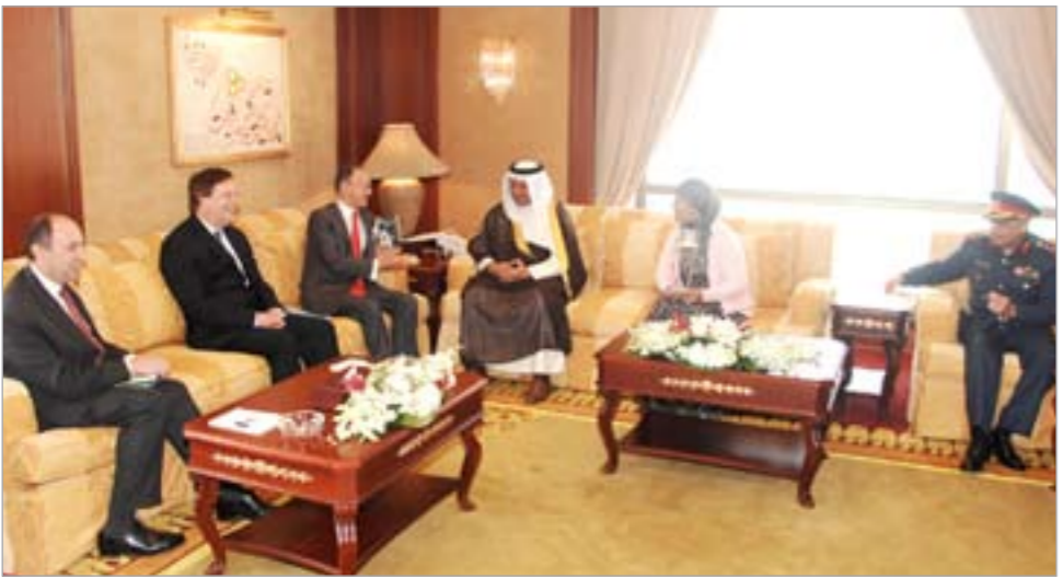
الشيخ جابر المبارك مستقبلاً وزير الخزانة البريطاني والوفد المرافق له

استقبل رئيس مجلس الوزراء بالإنابة ووزير الدفاع الشيخ جابر المبارك في قصر السيف أمس وزير الدولة للشؤون المالية والتجارية ووزير الخزانة للورد ساسون بالملكة المتحدة الورد ساسون والوفد المرافق له، وتم خلال اللقاء استعراض وبحث العلاقات الثنائية بين البلدين الصديقين إضافة إلى آخر التطورات والمستجدات على الساحتين الإقليمية والدولية والقضايا ذات الاهتمام المشترك. حضر المقابلة سفير المملكة المتحدة لدى الكويت السفير فرانك بيكر.