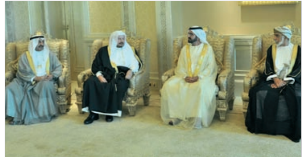
الشيخ محمد بن راشد خلال لقائه جاسم الخرافي ورؤساء المجالس

التعاون لسدول الخارجية العربية بإدراج بند دائم على جدول أعمال الاجتماعات الدورية حول ما تم تنفيذه من قرارات القمم الخليجية في جميع جوانب العمل الخليجي المشترك، وإحالة هذا الموضوع الى لجنة التنسيق لدراسته وتقديم تقرير حوله خلال ثلاثة اشهر. والتأكيد على فكرة ان يقوم رئيس الاجتماع الدوري الرابع للرابع أو رسالة أمام قمة مجلس التعاون على أن ينقل الأمين العام للجلسات المشتركة رسالة من رؤساء المجالس التشريعية لدولة الامارات العربية المتحدة من شأنها ان تدعم مسيرته الجارية في تعزيز مسيرة مجلس التعاون الخليجي