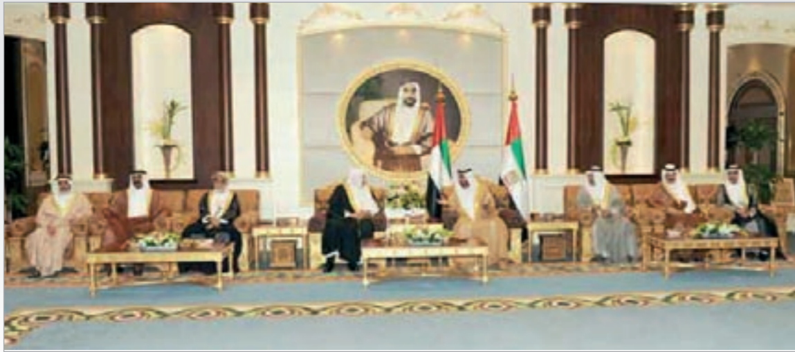
الشيخ خليفة بن زايد خلال لقائه رؤساء المجالس النيابية لدول التعاون

بما يلبي آمال وطموحات شعوبه ويحقق رفاهيتها. وأعرب الشيخ خليفة في هذه المناسبة عن تمنياته بنجاح الاجتماع الرابع لرؤساء البرلمانات الخليجية