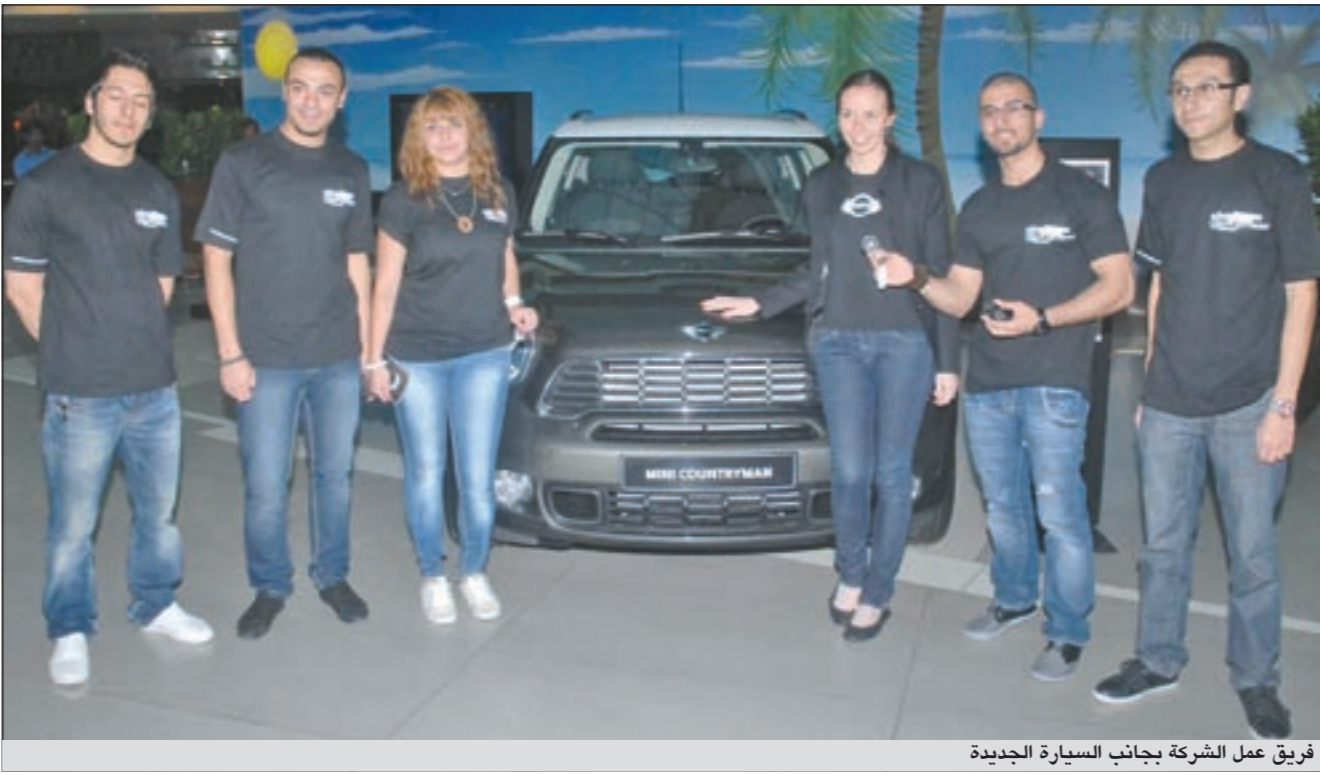
فريق عمل الشركة بجانب السيارة الجديدة

الأوروبي للاصطدام Euro NCAP لتصبح بذلك من أكثر السيارات أمانا على الطرقات اليوم. وقد صممت السيارة لتقدم أعلى مستويات الحماية للركاب البالغين والصغار على حد سواء في مختلف أنواع الاصطدامات، أما داخل MINI Countryman، فقد تمحور التصميم حول الراحة والعمالة مع الأسلوب المبدع. وتشمل التوليفات في هذه السيارة مجموعة من الألوان وخطوط التجهيز التي تسمح للعميل بالحصول على سيارته الخاصة من MINI Countryman.