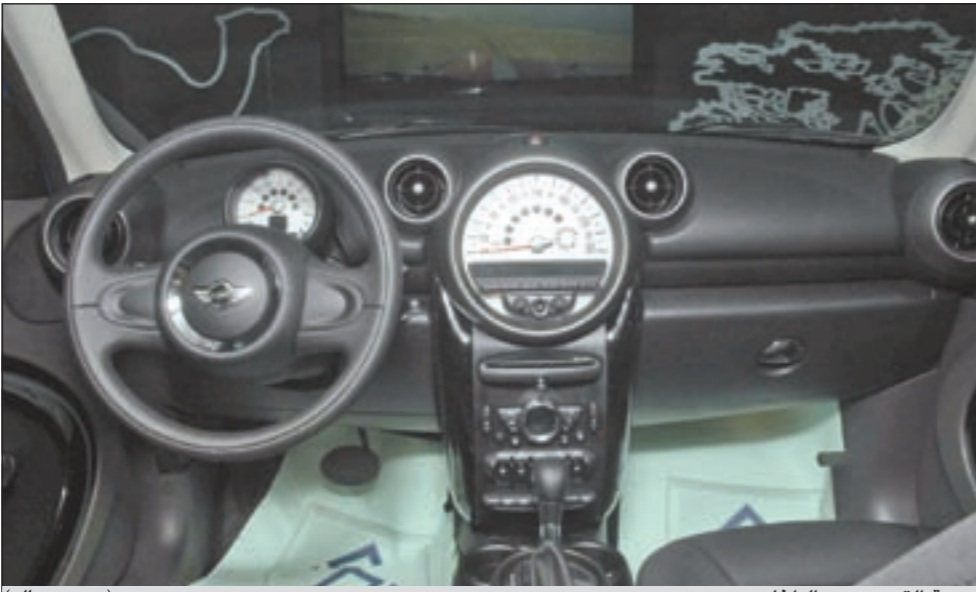
روعة التصميم من الداخل (سعود سالم)

والتي تتمتع بشخصيتها الفريدة. ومع الحيز الأمثل للرحلات في عطلات نهاية الأسبوع، تتسع السيارة لأمثلة تزيد بـ 16 ليترًا عن سعة الطرازات الأخرى ليصل الحجم إلى 350 ليترًا.