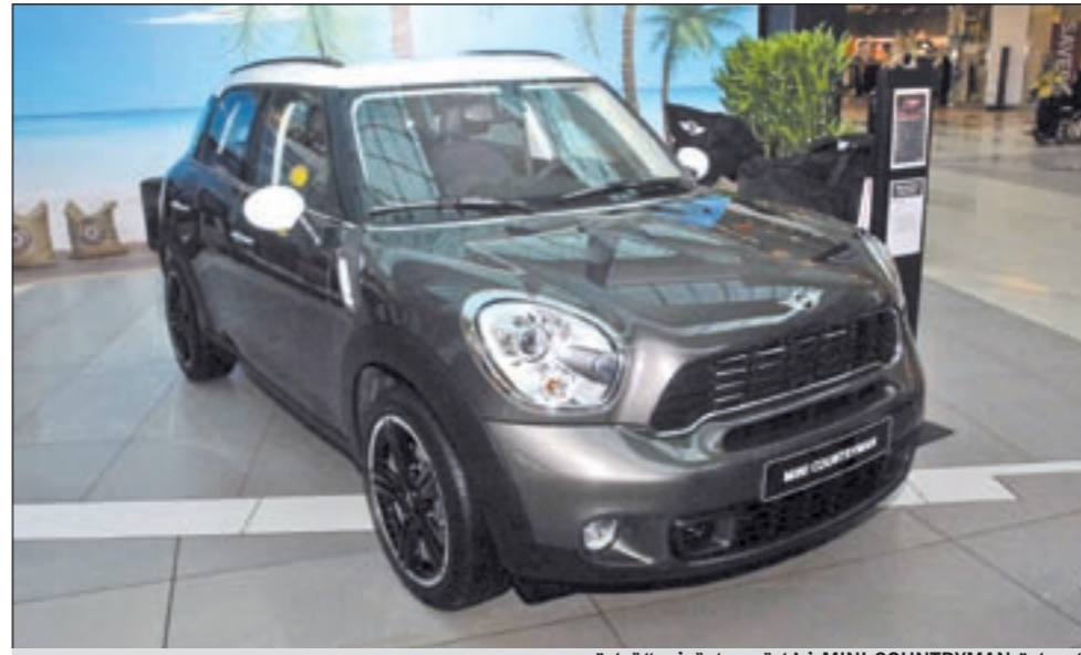
السيارة MINI COUNTRYMAN فخامة وبراعة في القيادة

الرباعي يصبح هذا الطراز الخيار الأمثل للتنقل في المدينة خلال الأسبوع بينما يتمتع في الوقت نفسه بمساحة كافية لرحلات عطلات نهاية الأسبوع. وتجدد الإشارة إلى أن MINI Countryman حصدت 5 نجوم في آخر نتائج اختبار السلامة