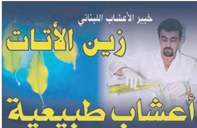
أحد اعلانات معمل «زين الأتات»

العامه لوقف كل ما يضر بصحة المواطن. وذكر نواب ان قرار الوزارة بإيقاف «معمل الدبية» للعائد للتاجر زين الأتات جاء بعد معلومات من عدد من البلدان العربية ان هذه المنتجات تحت اسم أنوية الأعشاب تتضمن سموماً ومواد كيميائية «مسرطنة» تضر بالصحة وكانت لها تداعيات سيئة على صحة من تناولها.