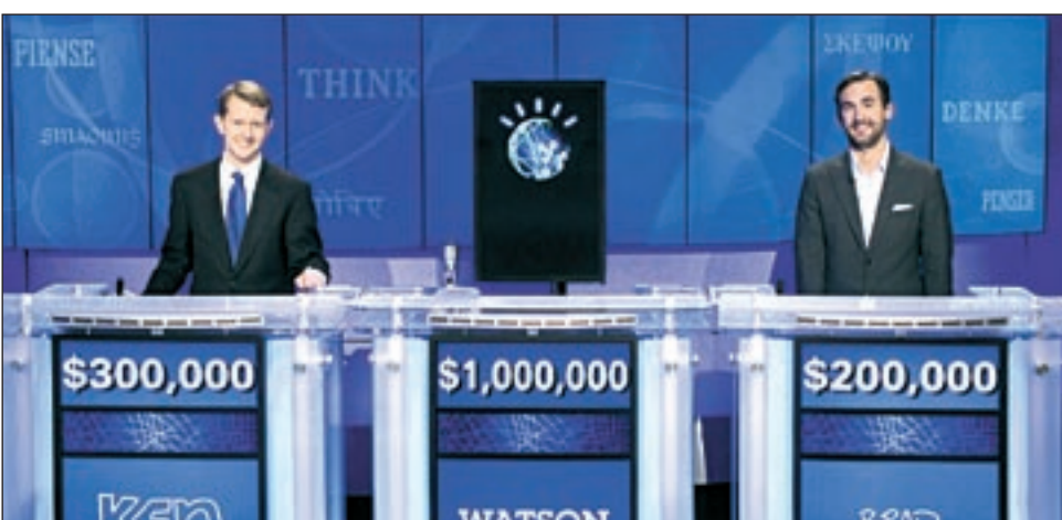
الحاسوب الخارق واتسون بعد فوزه بجائزة البرنامج الكبرى متوسطا منافسيه

الانترنت يستعين بما تسميه «أي بي إم»، «تكنولوجيا الإجابة عن الأسئلة، لتحليل المسائل المطروحة وجمع الأدلة ودراستها وتنظيم الاقتراحات التي يمكن ان تكون صحيحة. وقد فاجأ واتسون المشاهدين بقدرة على الإجابة عن أسئلة متصلة بالأحداث الجارية أكثر منها بالمعلومات العامة. وسوف يحصل واتسون على مليون دولار، وسيتأهل كجينغز صاحب المرتبة الثانية 300 ألف دولار، وبراد راتر 200 ألف دولار. وقد أعلنت «أي بي إم» انها ستقدم كل ما تفوز به للأعمال الخيرية، أما جينغز وراتر فيعتزمان فوها نصف أرباحهما.