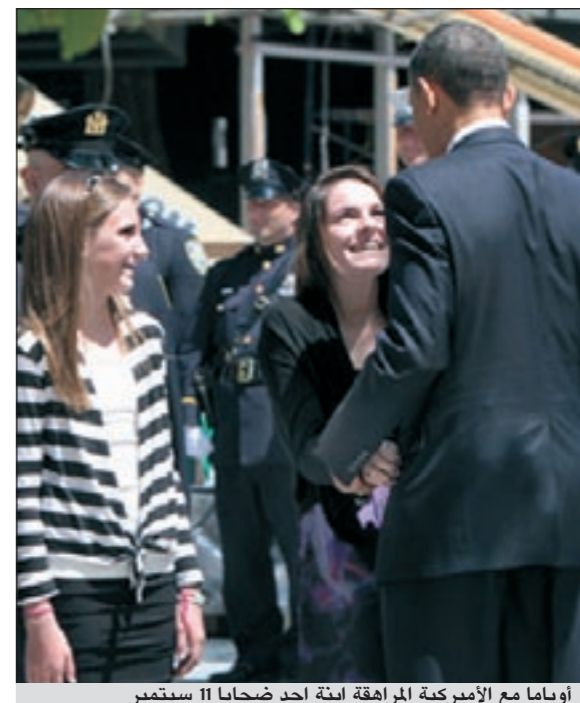
أوباما مع الأميركية المراهقة ابنة أحد ضحايا 11 سبتمبر

غير أن بعض وسائل الإعلام شككت في قدرة الرئيس على تأمين لقاء الفتاة بنجمها المفضل، ونقل الموقع عن مصادر مقربة من بيبير إنه سعد جدا لتلقي الاتصال من البيت الأبيض وأنه سيلتقي الفتاة حين يعود إلى الولايات المتحدة، ولم يحدد موعد اللقاء حتى الآن.