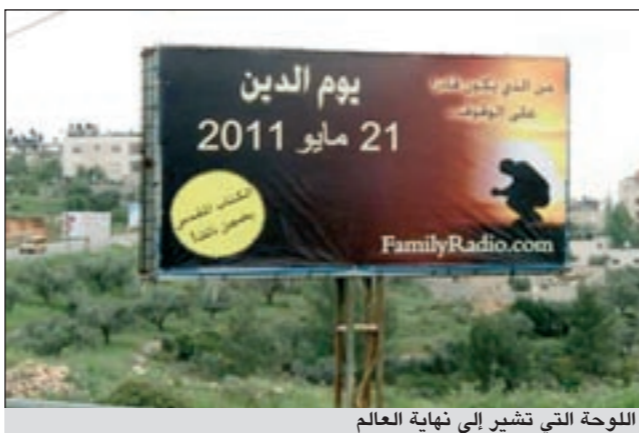
اللوحات التي تشير إلى نهاية العالم

على مدخل مدينة نابلس شمال الضفة الغربية بالقرب من حاجز حوارة». وأضاف الجاغوب: سالت