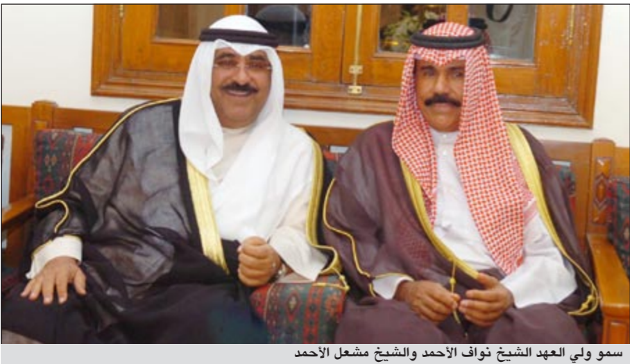
سمو ولي العهد الشيخ نواف الأحمد والشيخ مشعل الأحمد