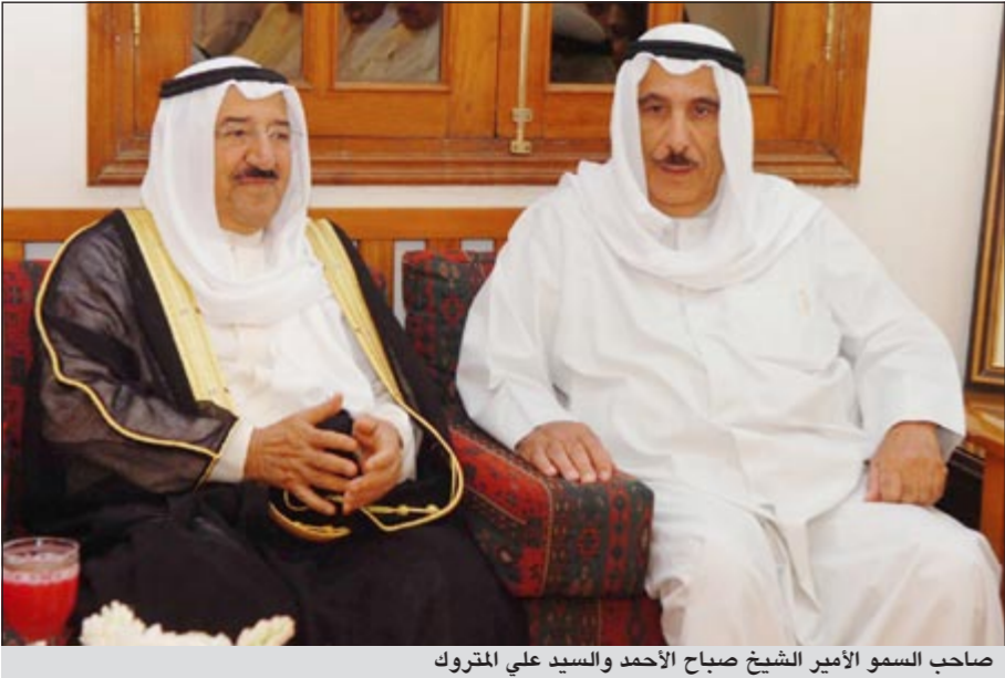
صاحب السمو الأمير الشيخ صباح الأحمد والسيد علي المتروك

وقد استقبل المتروك والحضور في الديوان صاحب السمو ومرافقيه بالحفاوة والترحاب، مؤكداً أن مثل هذه الزيارة تعزز التقارب بين أبناء الشعب والأسرة الحاكمة وتزيد الترابط ووحدته الصف.