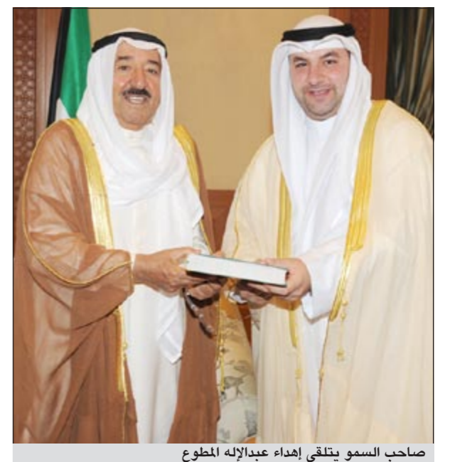
صاحب السمو يتلقى إهداء عبد الإله المطوع

الأمير استقبال صاحب السمو الأمير الشيخ صباح الأحمد بقصر السيف صباح امس سفير جمهورية السنغال لدى الكويت عبد الاحد امباكي،