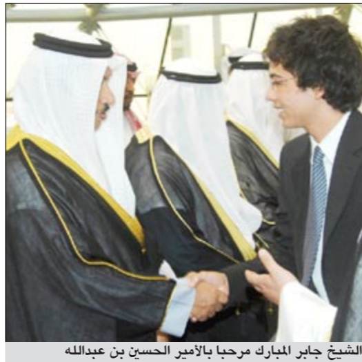
الشيخ جابر المبارك مرحبا بالأمير الحسين بن عبدالله