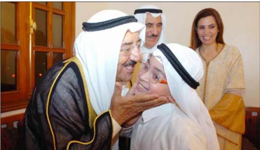
صاحب السمو الأمير في لفته انبوية مقبلا أحد أبناء الكويت ويبدو علي المتروك ودرولا دشتي

على الساحتين الاقليمية والدولية. وقد حضر المقابلة رئيس مجلس الامة جاسم الخرافي وكبار الشيوخ ونائب رئيس الحرس الوطني