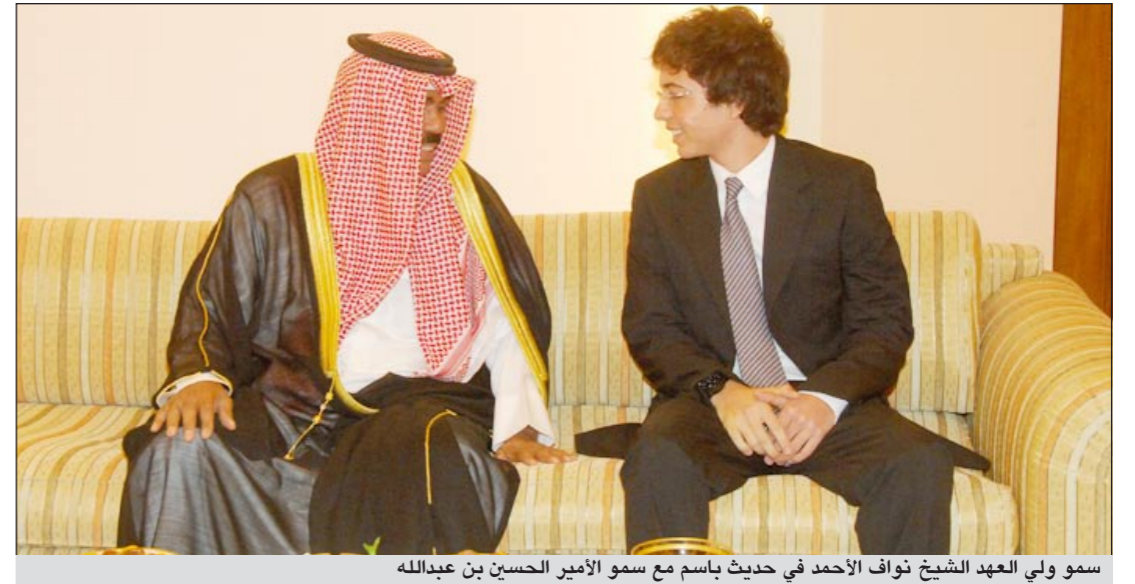
سمو ولي العهد الشيخ نواف الأحمد في حديث باسم مع سمو الأمير الحسين بن عبدالله