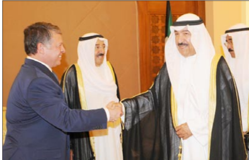
الشيخ جابر العبدالله والشيخ فيصل السعود يرحبان بالملك عبدالله الثاني

في إطار زيارته الرمضانية، جريا على عادته، قام صاحب السمو الأمير الشيخ صباح الأحمد ومرافقه سمو ولي العهد الشيخ نواف الأحمد والشيخ مشعل الأحمد بزيارة إلى ديوان السيد علي المتروك.