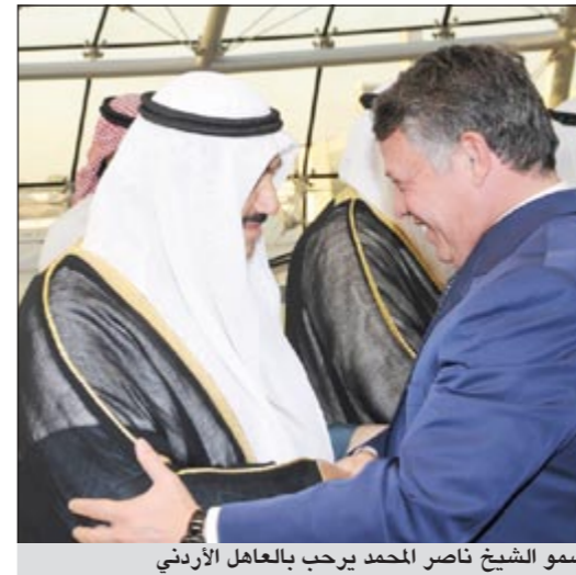
سمو الشيخ ناصر المحمد يرحب بالعاقل الأردني