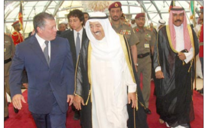
صاحب السمو الأمير الشيخ صباح الأحمد مستقبلا الملك عبدالله الثاني ويبدو سمو ولي العهد

المبارك وكبار المسؤولين بالدولة. هذا وأقام صاحب السمو الأمير الشيخ صباح الأحمد بقصر دسمان مساء امس مائدة افطار على شرف اخيه صاحب الجلالة الهاشمية الملك عبدالله الثاني ابن الحسين ملك المملكة الاردنية الهاشمية الشقيقة والوفد الرسمي المرافق لجلالته وذلك بمناسبة زيارته الاخوية للبلاد.