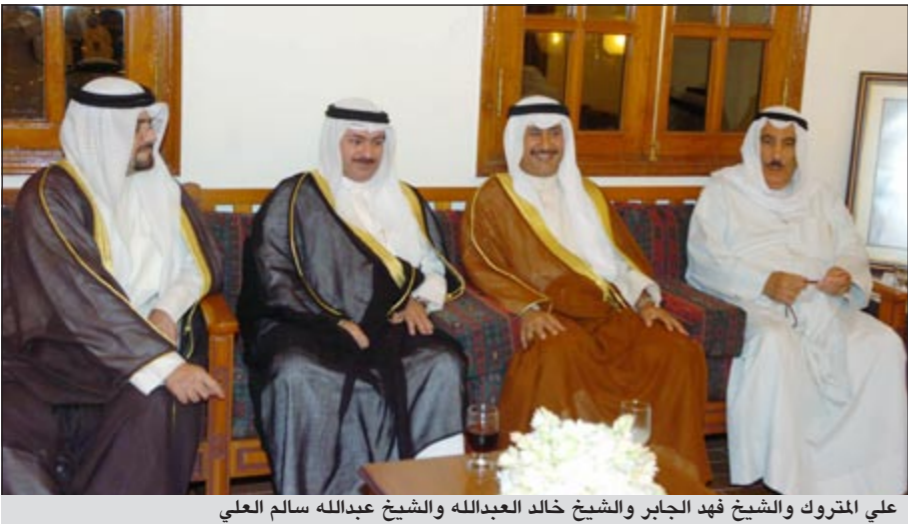
علي المتروك والشيخ فهد الجابر والشيخ خالد العبدالله والشيخ عبدالله سالم العلي