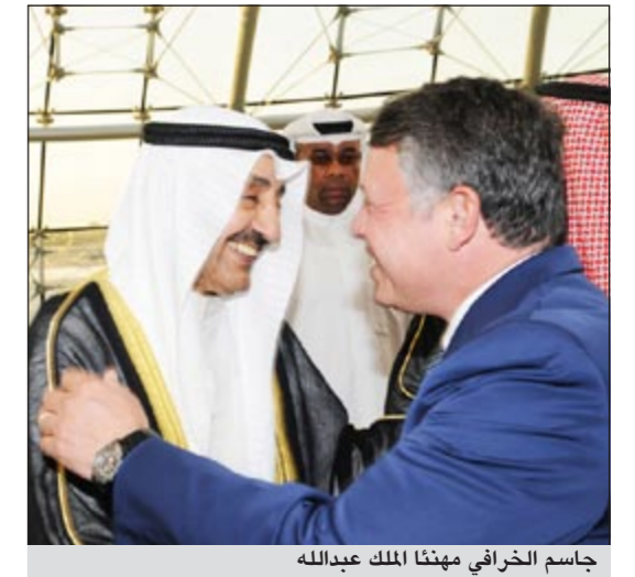
جاسم الخرافي مهنتا الملك عبدالله