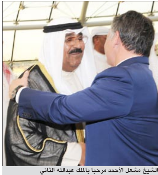
الشيخ مشعل الأحمد مرحبا بالملك عبدالله الثاني