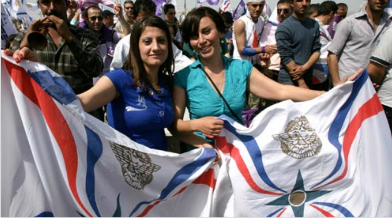
اشوريون عراقيون خلال احتفالهم برأس السنة الاشورية في دهوك