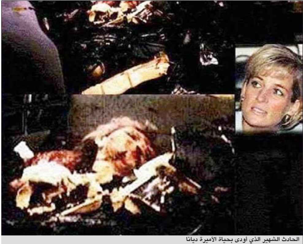
الحادث الشهير الذي أودى بحياة الأميرة ديانا

هناك شبها مربيا للغاية حول ما حدث في نفق ألما العام 1997، وفي محاكم العدل الملكية بعد عقد من الزمن». في الأسابيع التي تلت مهرجان «كان» بيع الفيلم إلى عشرات الدول حول العالم، فيما لا تزال المفاوضات مع 20 دولة أخرى على قدم وساق. حسب قول آلن ويتاغ قائلا: المؤلف الاستقصائي والمحامي الأمريكي المخضرم مارك لاين، الذي كشف للمرة الأولى الغطاء حول اغتيال جون كينيدي الأب، أيد النتائج المركزية للوثائقي خاصتي، الذي سيعرض في 6 يوليو المقبل بشكل كامل وأول كقرفة رئيسية في مهرجان «غالواي» السينمائي (مع العديد من المهرجانات الحريصة على عرضه). ويسأل: لماذا نكر العديد من الصحف البريطانية أن الجماهير التي شعرت بالملل خرجت أثناء العروض في «كان»، في حين أن ذلك غير صحيح ويتناقض بشكل قاطع مع أصوات الناس الحماسية التي سجلت خارج السينما من قبل تلفزيون «رويتز»؟ لماذا ادعوا أنني حاولت إخفاء الدعم المالي الذي كنت تلقينه من محمد الفايذ (والذي توفي ابنه دودي الفايذ في حادث ألما)، عندما كنت كتبت مقالات في صحيفتي الـ «غارديان» و«ديلي ميل» خلال الأسبوع السابق، شارحا بالتفصيل كيف ومن قام بتمويل الفيلم؟ لماذا ادعى العديد منهم أنني عرضت صورة «صادمة» لديانا في سكرات موتها، عندما لم يتم أبدا إدراج أي صورة من هذا القبيل؟