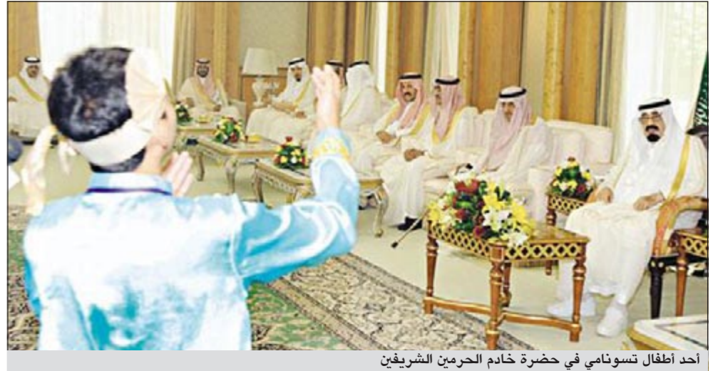
أحد أطفال تسونامي في حضرة خادم الحرمين الشريفين

وكالات: استقبل خادم الحرمين الشريفين الملك عبدالله بن عبدالعزيز آل سعود مجموعة من الأطفال الأيتام ضحايا كارثة تسونامي في إقليم باندا تشيه بجمهورية إندونيسيا، وقدم الأطفال خلال الاستقبال شكرهم وتقديرهم لخادم الحرمين الشريفين على كفالته لهم وكرمه الفياض ورعايته. كما قدموا للملك درعا تذكارية ولوحة تجسد برهم وتقديرهم لوادهم خادم الحرمين الشريفين. عقب ذلك ردد الأطفال مجموعة من الأناشيد الإسلامية أمام خادم الحرمين الشريفين. يذكر أن برنامج تحالف منظمة التعاون الإسلامي لرعاية أيتام ضحايا زلزال تسونامي في إقليم باندا تشيه بإندونيسيا قد بدأ بمبادرة كريمة من خادم