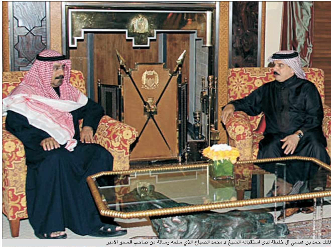
الملك حمد بن عيسى آل خليفة لدى استقباله الشيخ د.محمد الصباح الذي سلمه رسالة من صاحب السمو الأمير

الرياض- كونا: أعلن الديوان الملكي السعودي أمس ان خادم الحرمين الشريفين الملك عبدالله بن عبدالعزيز سيلقي عند الساعة الثانية من ظهر اليوم خطاباً موجهاً الى «بنائه وبناته شعب المملكة العربية السعودية الوفي». وأضاف البيان الذي أورثته وكالة الأنباء السعودية ان الخطاب يعقبه عدد من الأوامر الملكية الكريمة.