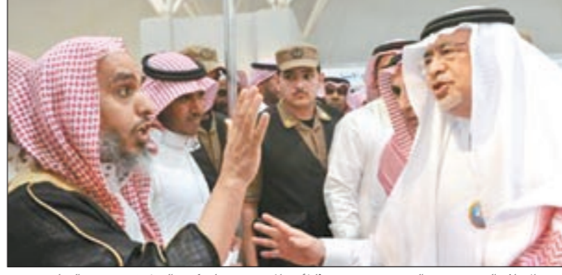
وزير الإعلام السعودي عبدالعزيز خوجه متحدثاً لأحد المعتزضين على كتب الغزل في معرض الرياض

والتي تتسم بالعلمانية». وشهدت آخر هذه «المناسبات» حديثاً حاداً من طرف أحدهم للوزير خوجة قال فيه «نحن نشكر جهودك المباركة، إلا أن تواجد النساء وتوعية الكتب التي تعرض في المعرض، والتي فيها بعض الأفكار الهدامة والعلمانية لا يرضي الله ورسوله»، وأضاف «هذه الكتب التي يتم طباعتها وتوزيعها تشهد أفكاراً كفرية، وأقلها أشعار غزل فاحش، وكل كتاب سنسأل عنه». وكانت المجموعات أثارت الشغب فور وصول وزير الثقافة والإعلام السعودي إلى المعرض لحضور توقيع الأديب السعودي الكبير عبدالله بن إدريس.