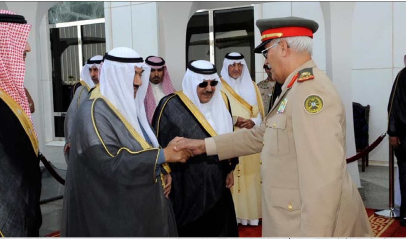
سمو رئيس الوزراء الشيخ ناصر المحمد مصافحا مستقبليه لدى وصوله الى جدة