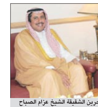
الشيخ علي بن خليفة وسفيرنا لدى مملكة البحرين الشقيقة الشيخ عزام الصباح

ان لسمو رئيس مجلس الوزراء الشيخ ناصر المحمد مكانة كبيرة في قلوب البحرينيين قيادة وشعبا وهناك فرحة كبيرة بضيف البحرين الكبير».