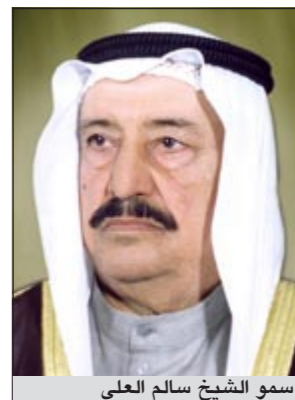
سمو الشيخ سالم العلي

وبين الأذينة أن خطة الوزارة تضع ضمن أولوياتها تأمين الكهرباء ودور العبادة على مستوى البلاد لتأدية الشعائر الرمضانية بسهولة ويسر.