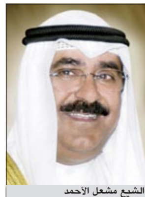
الشيخ مشعل الأحمد

والشيخ مشعل الأحمد بأسمى آيات التهاني والتبريكات إلى مقام صاحب السمو الأمير القائد الشريفيين الملك عبدالله بن عبدالعزيز آل سعود ملك المملكة العربية السعودية الشقيقة عبر فيها عن خالص تعازيه وصادق مواساته بوفاة المغفور له بإذن الله تعالى سمو الأمير خالد بن