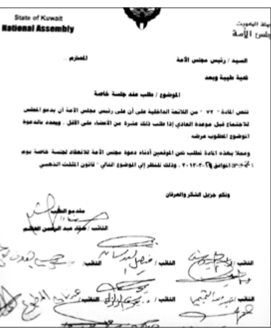
صورة زكروغرافية لطلب الجلسة الخاصة لمناقشة موضوع المثلث الذهبي

الكويت وبعض الدول متعلقة بالتعاون القانوني والقضائي والعسكري ونقل المحكوم عليهم وتسليم المجرمين وقمع الإرهاب، كما أقر المجلس المداولة الثانية للحلقة السنوية الثانية وأحالها الى الحكومة، واعتمد الاتفاقية الخاصة بتسوية ديون الخطوط الجوية العراقية المستحقة لتطيرتها «الكويتية»، وذلك بدفع مبلغ 500 مليون دينار لـ «الكويتية»، وأقر المجلس مرسوم الضرورة الخاص بتعديل أحكام قانون الرعاية السكنية. وكلف مجلس الأمة لجنة حقوق الإنسان بمتابعة مستجدات قضية معتقليننا في غوانتانامو.