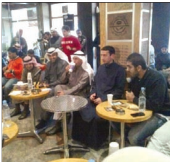
الشيخ محمد العبدالله ود. نايف الحجرف مع المفردين

فوائد القروض مازال يدرس من قبل وزارة المالية، على الرغم مما أعلنه وزير المالية مصطفى الشمالي أن صندوق المعسرين هو الحل. وأشار العبدالله إلى أن البنك الدولي طلب من الحكومة وضع تشريع لسرية تداول المعلومات لأنها وجدت أن المعلومة متاحة للجميع. وأضاف أنه غير صحيح تخصيص مبلغ 250 مليون دولار لمراقبة «تويتر» والمواقع الإلكترونية، مشددا على أن الكويت الدولة الوحيدة التي لم تشترع قانونا يمنع تداول المعلومة. من جهته، قال الوزير مرت الحجرف إن الكويت مرت بحرف استثنائي وتحثنا إلى حلول استثنائية من الأطراف كافة وليس من طرف واحد، مشيرا إلى ان الجمع اصبح سياسيا فتحكمت السياسة في جميع المجالات كالرياضة والفن وغيرهما. هذا وقال المصدر الوزاري ان الحكومة تستحيل الى المجلس تقارير بقضايا الاعتداء على المال العام استجابة لطلب المجلس وسيتم ذلك مرتين سنويا وبيدانا اجراءات تنفيذ ذلك.