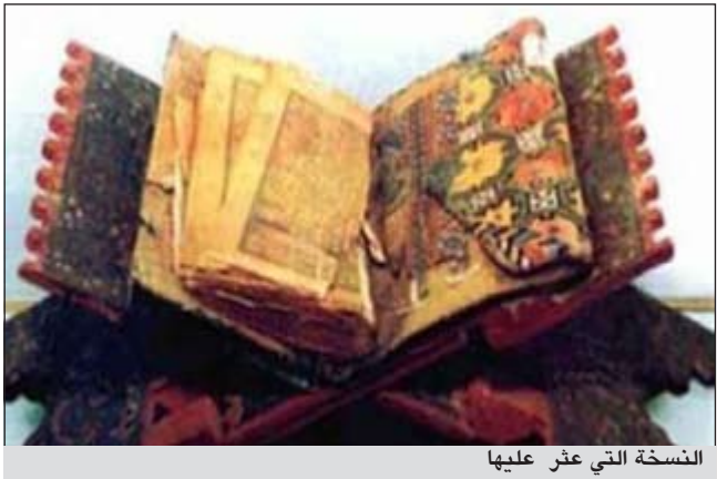
النسخة التي عثر عليها

وقالت المصادر إن عروضاً مغرية قدمت للشباب لدفعه على بيع نسخة القرآن الكريم كان آخرها 12 مليون ريال يعني أي ما يعادل نحو 56 ألف دولار، إلا إنه رفض ذلك العرض.