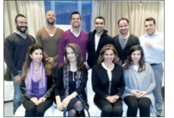
نجلا مع عدد من الطاقات الشبابية الإعلامية

مجموعة من الإعلاميين المسؤولين عن فن التعامل وطريقة جذب المشاهد من خلال الحوار، وقد قدمت لهم ورشة عمل تساعد على فهم مبادئ الحياة بطريقة ايجابية. وتابعت: للأمانة الإعلام يعتبر من أكثر الوسائل التي تؤثر في المجتمعات وهذا ما شجعتني أن تكون لنا وقفة من خلال تدريب الوجة الإعلامية على كيفية تغيير نظرة المجتمع للإعلام