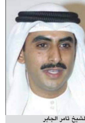
الشيخ ثامر الجابر

الشيخ ثامر الجابر وعدد من الشخصيات السعودية السياسية والإعلامية والاقتصادية. وأشاد بما تشهده المملكة من نقلات وقفزات نوعية في عهد خادم الحرمين الشريفين الملك عبدالله بن عبدالعزيز والحكامة العالية للمملكة في المحافل العربية والإسلامية والإقليمية والدولية. ويأتي دعم العجمي ان المملكة تعد من الدول الداعمة والأساسية في ارساء سبل السلام والاستقرار في العالم،