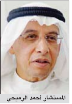
المستشار احمد الرميحي

اعلن الوكيل المساعد لشؤون مراقبي شؤون التوظيف بديوان الخدمة المدنية المستشار احمد الرميحي ان الديوان شكل اللجنة الرئيسية لإنجاز وتنفيذ البديل الاستراتيجي لعلاج السلبات والمشكلات المرتبطة بجدول الأجور والمراجعات والكوادر المالية على مستوى الجهات الحكومية. وقال الرميحي الذي يشغل رئيس فريق عمل وضع إجراءات التسكين والتظلمات في تصريح صحفي أمس ان اختصاصات الفريق تتمثل في تحديد أوجه الاختلاف ونقاط الالتقاء بين الوضعين الحالي والمستقبلي وبلورة الإجراءات التي سيتم بموجبها نقل الموظفين وتسكينهم بالنظام الجديد، وأشار إلى أهمية وضع المبادئ والأسس الواجبة للتنفيذ بالنسبة للأوضاع الجديدة لنظام التقييم إضافة إلى وضع نظام عام لإجراءات ومستويات الشكاوى والتظلمات واليات الرد عليها. وأضاف أن الفريق حدد الآلية التي سيسير عليها والبرنامج الزمني لتنفيذ مهامه وقسم هذا البرنامج إلى مراحل عديدة، مشيراً إلى أنه تم الاطلاع على بعض الدراسات والتجارب التي أجرتها بعض الجهات حول تسكين موظفيها على الكوادر المستخدمة للاستعداد بها عند وضع الفريق مقترحاته. وذكر الرميحي أن الفريق أعد تصوراً أولياً للإجراءات التي سيتم بموجبها نقل الموظفين وتسكينهم بالنظام الجديد ومرحلة وضع تصور للمبادئ والأسس الواجبة للتنفيذ بالنسبة للأوضاع الجديدة للنظام.